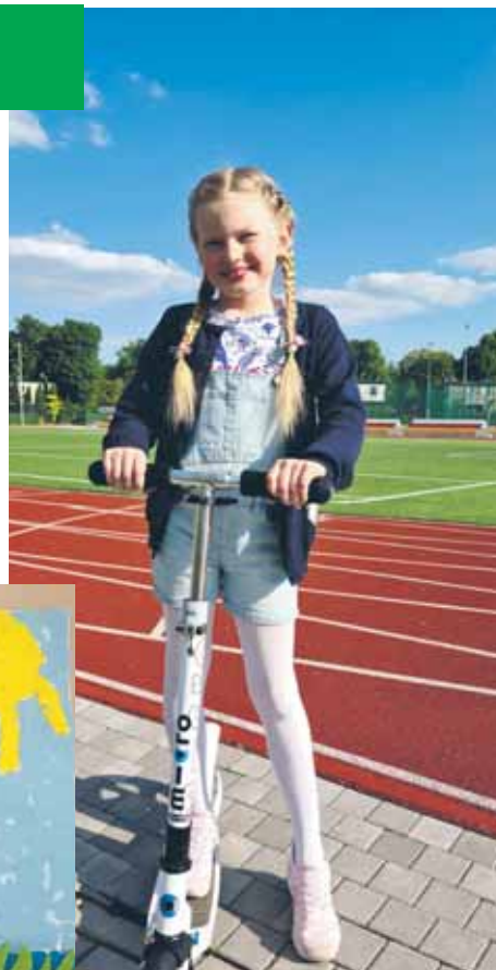
Gratulujemy sukcesu i życzymy dalszych kreatywnych prac plastycznych!