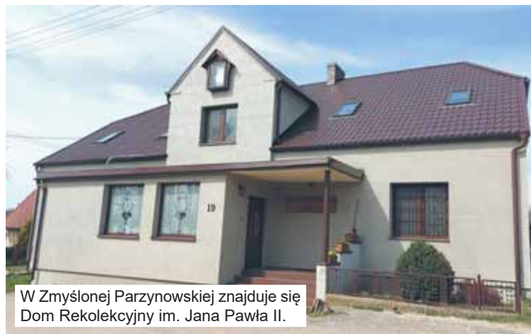
W Zmysłonej Parzynowskiej znajduje się Dom Rekolekcyjny im. Jana Pawła II.

Pawłowi II w dniu jego beatyfikacji - obelisk został poświęcony dokładnie 10 lat temu, 1 maja 2011 r.