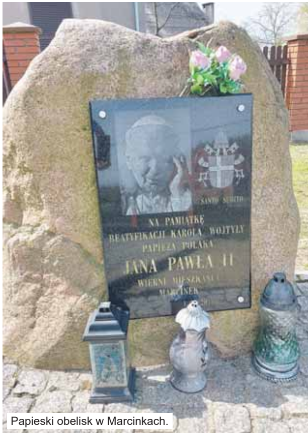
Papieski obelisk w Marcinkach.

R u s z a m y d a l e j - n a u l. G r u n - w a l d z k i e j „s t u k n i e” n a m n a l i c z n i k u 2,1 k m. P o p r z e j e c h a n i u n i e s p e ł n a