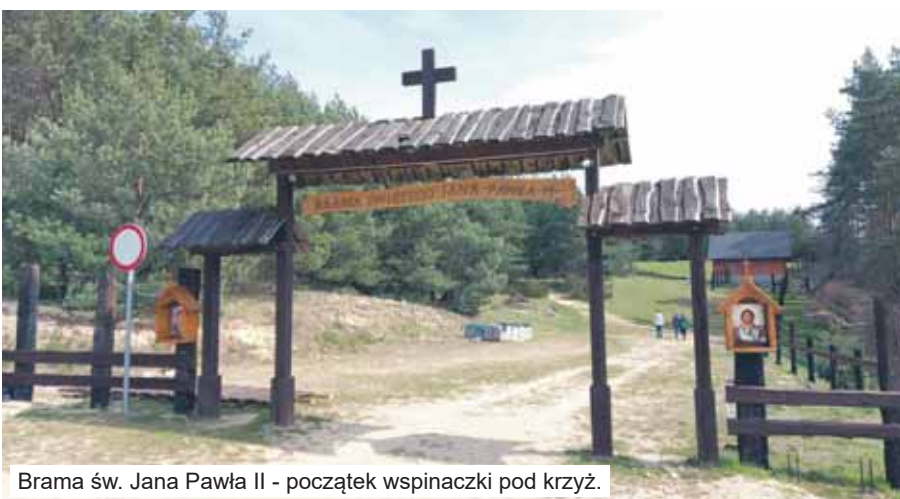
Brama św. Jana Pawła II - początek wspinaczki pod krzyż.

Przed nami Bierzów - skręcamy w prawo do centrum wioski. Przebyliśmy 7,5 km. Jadąc przez tę miejscowość, ujrzymy nowy krzyż z jasnego drewna. U jego stóp kamienna tablica okolicznościowa, dar mieszkańców poświęcony Janowi