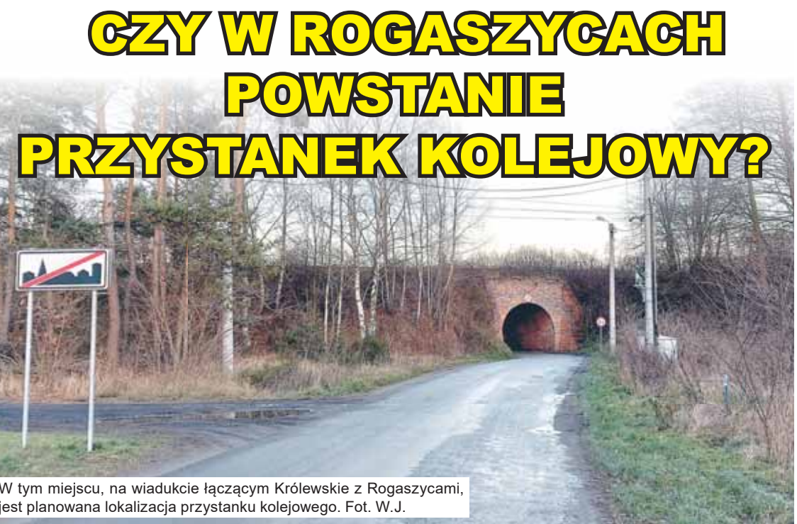
W tym miejscu, na wiadukcie łączącym Królewskie z Rogaszycami, jest planowana lokalizacja przystanku kolejowego.