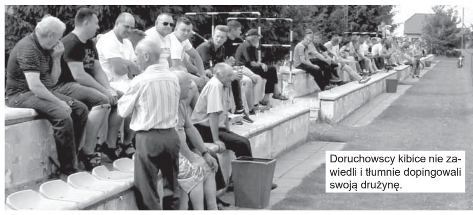
Doruchowscy kibice nie zawiedli i tłumnie dopingowali swoją drużynę.