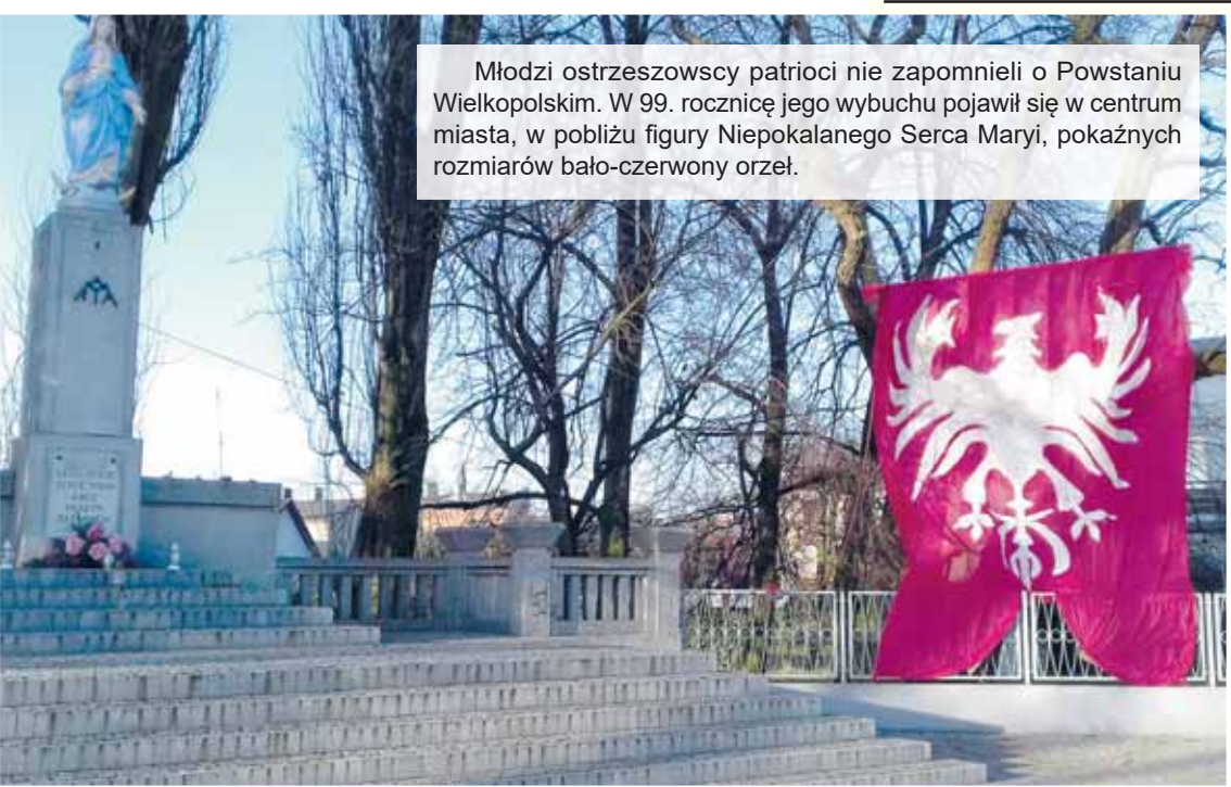
Młodzi ostrzeszowscy patrioci nie zapomnieli o Powstaniu Wielkopolskim. W 99. rocznicę jego wybuchu pojawił się w centrum miasta, w pobliżu figury Niepokalanego Serca Maryi, okazałych rozmiarów bało-czerwony orzeł.