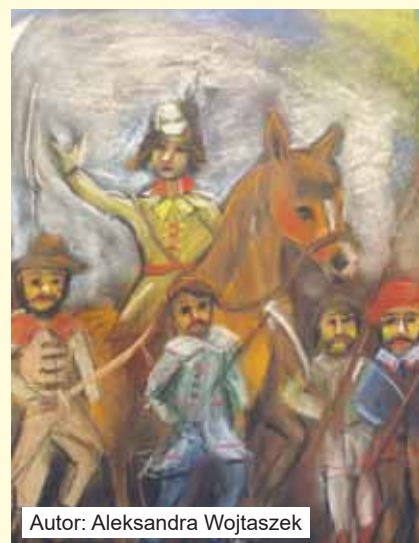
Autor: Aleksandra Wojtaszek