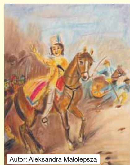
Autor: Aleksandra Małolepsza

uczniowie młodzi plastycy tworzący obrazy pod kierunkiem Elżbiety Lubińskiej w pracowni plastycznej OCK. Wśród nagrodzonych znalazły się prace Aleksandry Wojtaszek (12 lat) i Radiki Łepskiej (16 lat). Prace Jessiki Kramarczyk (10 lat) i Aleksandry Małolepszej (11 lat) zostały zakwalifikowane do wystawy. K.J.