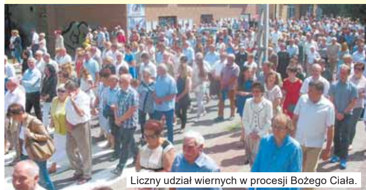
Liczny udział wiernych w procesji Bożego Ciała.

Około 40 procent wiernych mieszkających w powiecie ostrzeszowskim uczestniczy w niedzielnej mszy świętej. Do takiego wniosku składają wyniki liczenia wiernych, które odbyło się w niedzielę, 15 października, w ponad 10 tys. polskich parafii. Głównym celem corocznego liczenia jest sprawdzenie, ile osób przychodzi na msze św. (communicantes), ile z nich stanowią mężczyźni, ile kobiety, a ilu wiernych przystępuje do komunii świętej (communicantes).