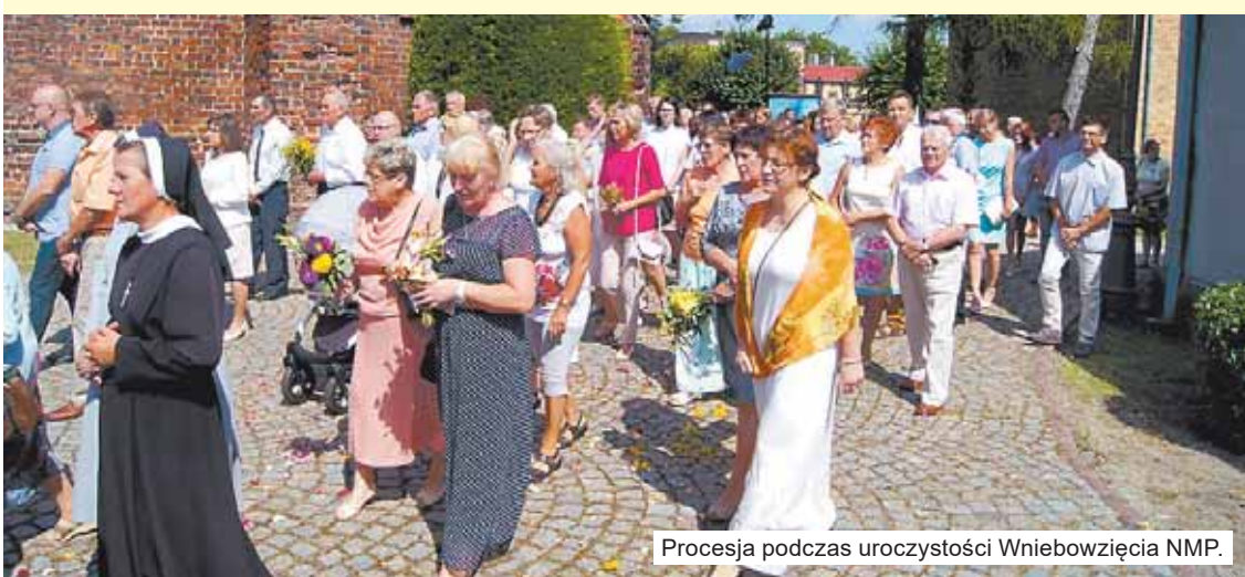
Procesja podczas uroczystości Wniebowzięcia NMP.