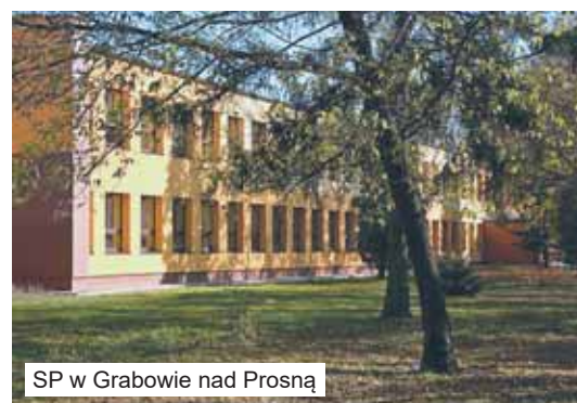
SP w Grabowie nad Prosną

Dzisiaj w naszym cyklu prezentujemy stan przygotowań do nadchodzącego roku szkolnego w MiG Grabów nad Prosną. Na terenie miasta i gminy znajduje się gimnazjum i cztery szkoły podstawowe, z których jedna - w Bobrownikach, nie jest pod pieczęą gminy, gdyż przynależy do miejscowego stowarzyszenia.