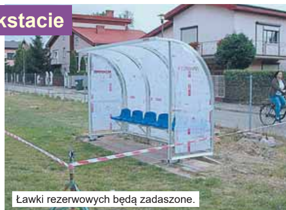
Ławki rezerwowych będą zadaszone.