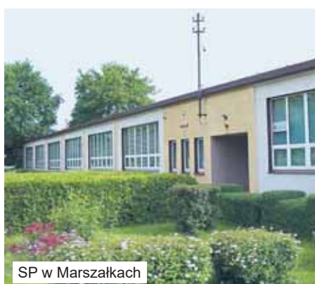
SP w Marszałkach

Największą ze szkół podstawowych jest SP w Grabowie nad Prosną im. UNESCO . Od nowego roku szkolnego będzie tam uczęszczać 533 uczniów (łącznie z „zerówką”, do której pójdzie 22 dzieci). Do trzech klas pierwszych pójdzie 64