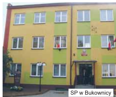
SP w Bukownicy

Gimnazjum im. Zjednoczonej Europy w Grabowie nad Prosną , jako jedyne w powiecie, nie będzie przyłączone do szkoły podstawowej tylko pozostanie samodzielną placówką, podlegającą stopniowemu „wygaszeniu”. Mówiąc krótko - za dwa lata, gdy ostatnie klasy opuszczą gury szkoły, gimnazjum przestanie istnieć. W tym roku szkoła jeszcze tętni życiem, bo choć nie ma już klas pierwszych, to wciąż chodzi tu 140 uczniów klas II (trzy oddziały) i klas III (dwa oddziały). Korzystając z dobrego wyposażenia pracowni znajdujących się w budynku gimnazjum, zdecydowano, że część uczniów pobliskiej szkoły podstawowej będzie tu przychodzić na zajęcia z in-