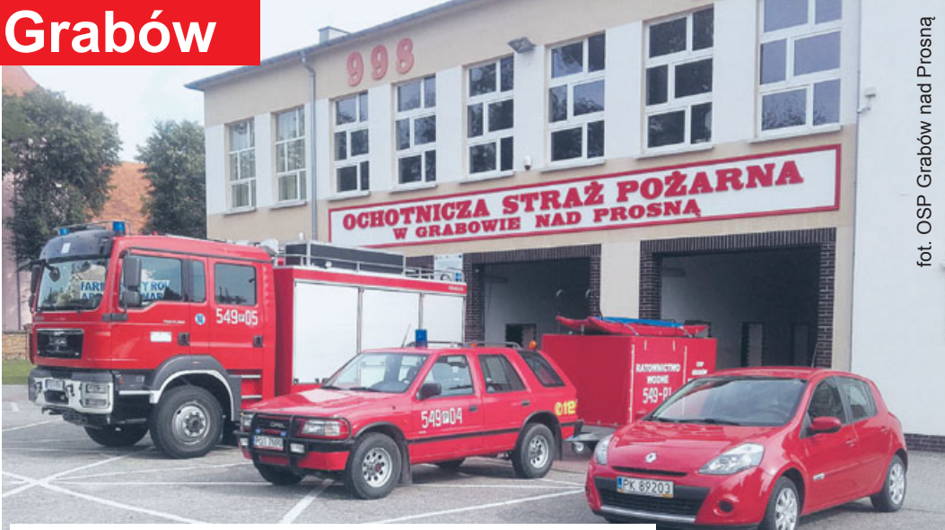
Flota pojazdów OSP Grabów - pierwszy od prawej to najnowszy nabytek.