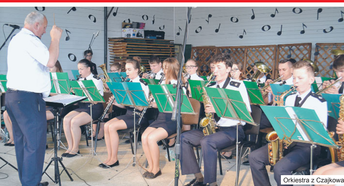
Orkiestra z Czajkowa.

Mimo że pogoda była niepewna, publiczność nie zawiodła i w niedzielę, 2 lipca, tłumnie pojawiła się na VII Powiatowym Przeglądzie Orkiestr Dętych w Czajkowie. Organizatorem imprezy było Starostwo Powiatowe, Urząd Gminy w Czajkowie i Gmina Orkiestra Dęta przy OSP w Czajkowie.