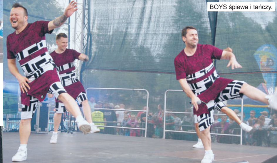
BOYS śpiewa i tańczy.