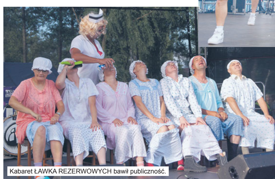
Kabaret ŁAWKA REZERWOWYCH bawił publiczność.

brakuje talentów, i to nie tylko wśród młodzieży, potwierdza występ kabaretu „Ławka Rezerwowych” z Ligoty. Wesoło i trochę tajemniczo było też podczas występu