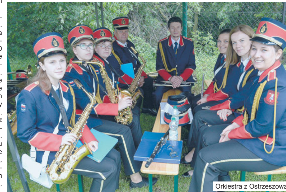
Orkiestra z Ostrzeszowa.