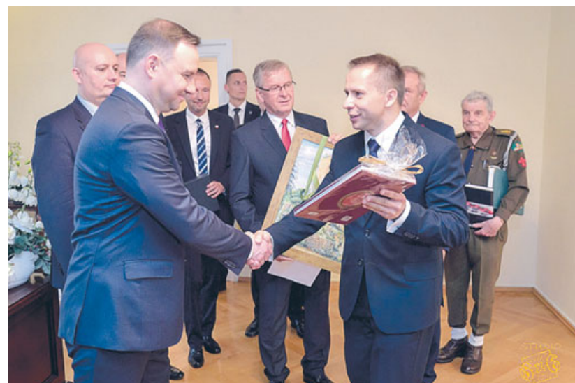
Pierwszym etapem wizyty pana prezydenta Andrzeja Dudy w Ostrzeszowie było spotkanie z samorządowcami w sali ślubów w ratuszu. Podczas