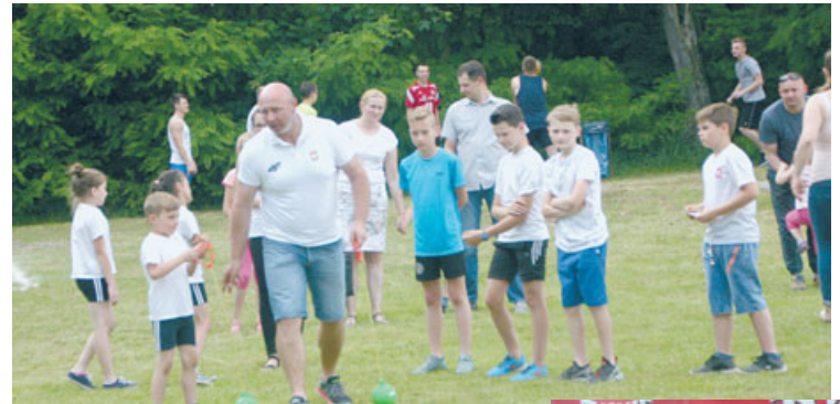
Pod okiem mistrza Ziółkowskiego

11 czerwca odbyły się uroczyste obchody 65-lecia LZS Morawin. Rozpoczęła je msza św. Pierwszą atrakcją, przygotowaną przez organizatorów, był I Bieg na Skraju Wielkopolski,