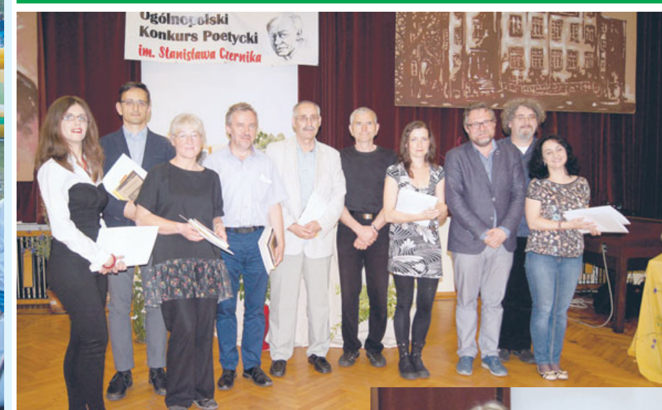
Laureaci w kategorii powyżej 19 lat.