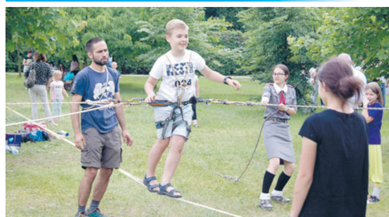
4 czerwca parkiem im. Jana Pawła II w Ostrzeszowie zawładnęły dzieci. To zabawa trwała także podczas prezentacji przedstawień teatralnych.