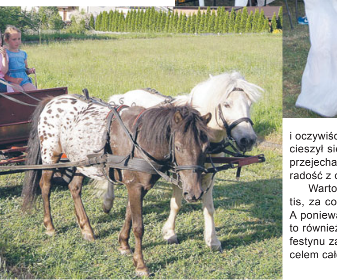
W Olszynie w minioną niedzielę mieszkańcy miejscowości i ich rodziny uczestniczyli w festynie rodzinnym. W programie znalazły się atrakcje dla dzieci i dorosłych, a także zabawy i konkursy.

Z myślą o najmłodszych mieszkańcach Olszyny Rada Sołectwa tej wsi z pomocą KGW zorganizowała festyn rodzinny. Jak wskazuje nazwa, również dorośli mogli coś dla siebie znaleźć, jednakże najważniejsze były dzieci. Główną dla nich atrakcją stanowiły zabawy i konkursy. Było ich siedem, m.in.: rzucanie do celu, przebiegnięcie w worku, rzut ringo, przejście wraz z rodzicami na kilkuosobowych nartach... Ponadto na placu zabaw w różnych miejscach znajdowały się obrazki, które trzeba było odnaleźć i namalować. Kto wszystkie zadania wykonał, otrzymywał nagrodę. Powodzeniem cieszył się kącik malowania twarzy. Z czasem więc na placu zabaw przybywało tygrysków i innych stworzków. Z pomocą strażaków z OSP Ostrzeszów można było „gasić ogień”. Dzieci z zainteresowaniem oglądały także „zabytkowy” park maszynowy, a w nim trabanta, fiata 125