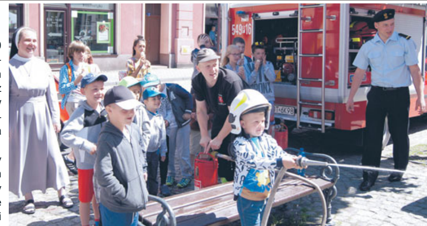
dla młodzieży był symulator, w którym można było przekonać się na własnej skórze, jak to jest, gdy samochód dachuje. Oczywiście ciekawe atrakcje wypłynęły również ze strony samych dzieci, które przygotowały taneczne oraz wokalne występy artystyczne.

1 czerwca, równo o godzinie 10.00 na ostrzeszowskim Rynku, przy wesołej muzyce oraz przygotowanych atrakcjach, policjanci, strażacy oraz ratownicy medyczni połączyli siły i w ramach międzynarodowego Dnia Dziecka przygotowali miłą niespodziankę dla dzieci małych i dużych. Dla najmniejszych przygotowany był dmuchany zamek, dla starszych - domek z płonącymi ognikami, przy którym osobiście mogły zmierzyć się z trudnością gaszenia pożaru, z kolei