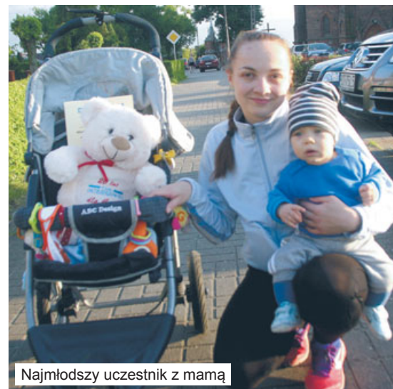
Najmłodszy uczestnik z mamą