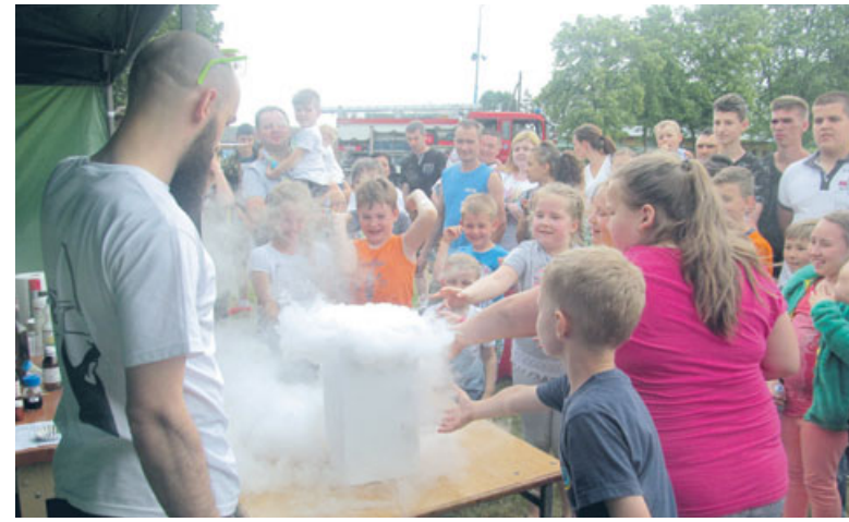
W minioną niedzielę na stadionie w Kraszewicach dzieci obchodzili swoje wyjątkowe święto. Zabawa rozpoczęła się już w sobotę turniejem piłkarskim na Orliku, gdzie rywalizowali ze sobą najmłodszy piłkarze.

W niedzielę od godziny 15.00 na dzieci czekało wiele nieodpłatnych atrakcji. W tym dniu w Kraszewicach odbył się festyn rodzinny, w którym uczestniczyli mieszkańcy miejscowości i ich rodziny. Program imprezy nie zabrakło propozycji zarówno dla młodszych, jak i starszych, a wśród nich ogromne zjeżdżalnie, ścianki wspinaczkowe, kule wodne, magiczny tunel, miotła kredka, dmuchane zamki i place zabaw. W programie znalazły się również magiczne balony, zawody strzeleckie, pokazy chemiczne, konkurs piosenki dla dzieci i wiele innych atrakcji. Wszyscy uczestnicy festynu mogli wziąć udział w loterii fantowej oraz poczęstować się smakołykami, a dla dzieci przygotowano darmowe napoje, kielbaski z grilla i lody. Wieczorem nastąpiło losowanie nagród głównych. Dziękujemy uczestnikom festynu za przybycie, sponsorom za ogromny wkład w organizację oraz wszystkim, którzy w jakikolwiek sposób przyczynili się do przeprowadzenia Dnia Dziecka w Kraszewicach.