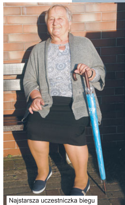
Najstarsza uczestniczka biegu