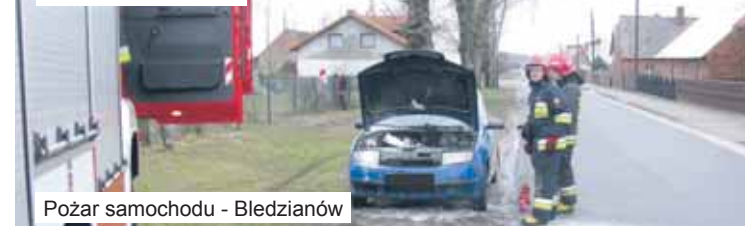
Pożar samochodu - Bledzianów