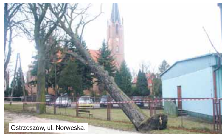
Ostrzeszów, ul. Norweska.