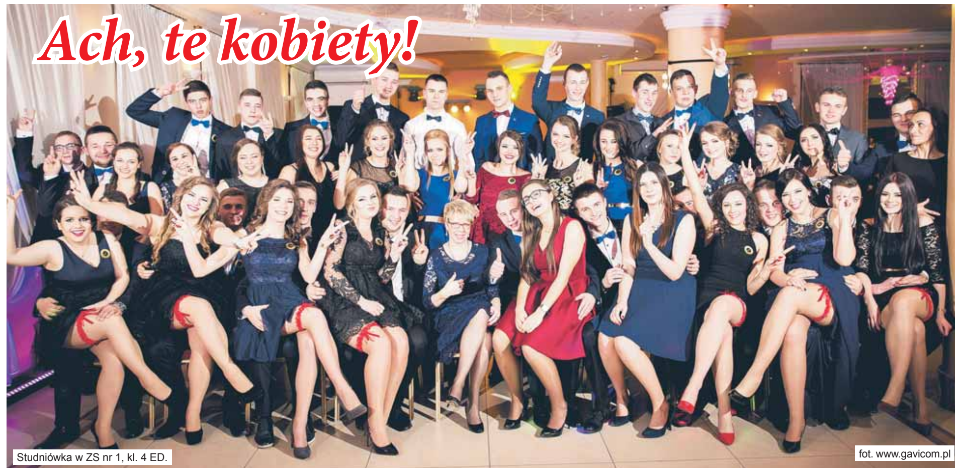
Studniówka w ZS nr 1, kl. 4 ED.