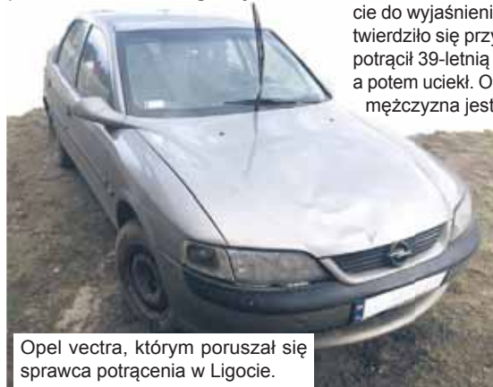
Opel vectra, którym poruszał się sprawca potrącenia w Ligocie.

Sprawca „wpadł” kilka dni temu podczas kontroli drogowej.