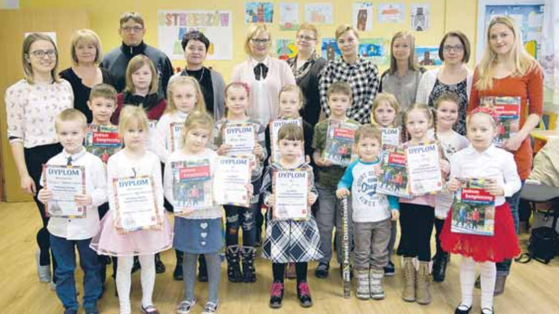
Dzień Języka Ojczystego oraz podsumowanie Konkursu Plastycznego nt.: OSTRZESZÓW MOJE MIASTO w Przedszkolu nr 1 21.02.2017