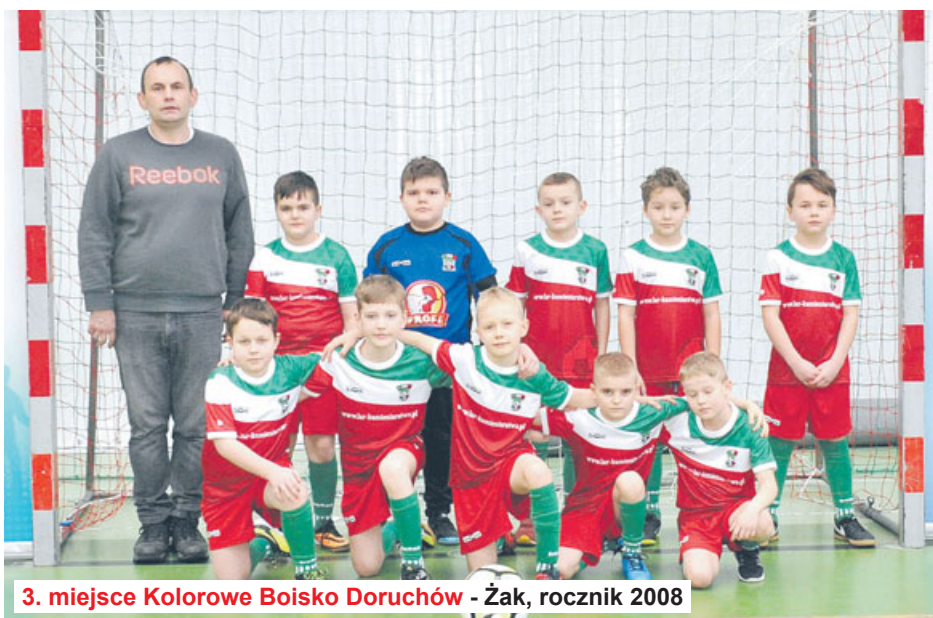
3. miejsce Kolorowe Boisko Doruchów - Żak, rocznik 2008