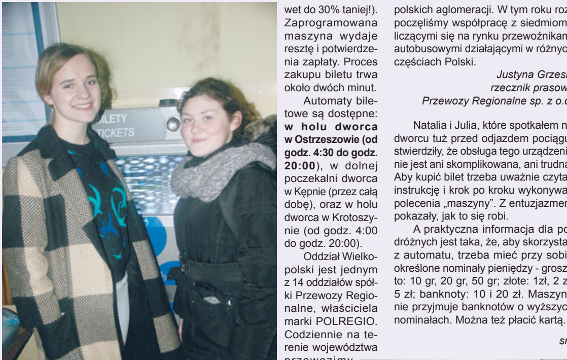
W Ostrzeszowie, Kępnie i Krotoszynie bilety na pociągi POLREGIO, uruchamiane przez Przewozy Regionalne, są już dostępne w biletomatach! Na dworcach postawione zostały automaty biletowe do dyspozycji pasażerów, a sprzedaż nie jest ograniczona godzinami otwarcia okienka kasowego. Automaty wyposażone są w ekrany dotykowe i są łatwe w obsłudze. Po wpisaniu stacji docelowej wyświetlają najbliższe połączenia oraz przyjmują obie formy płatności: gotówkę i kartę płatniczą.