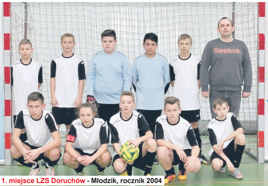
1. miejsce LZS Doruchów - Młodzik, rocznik 2004