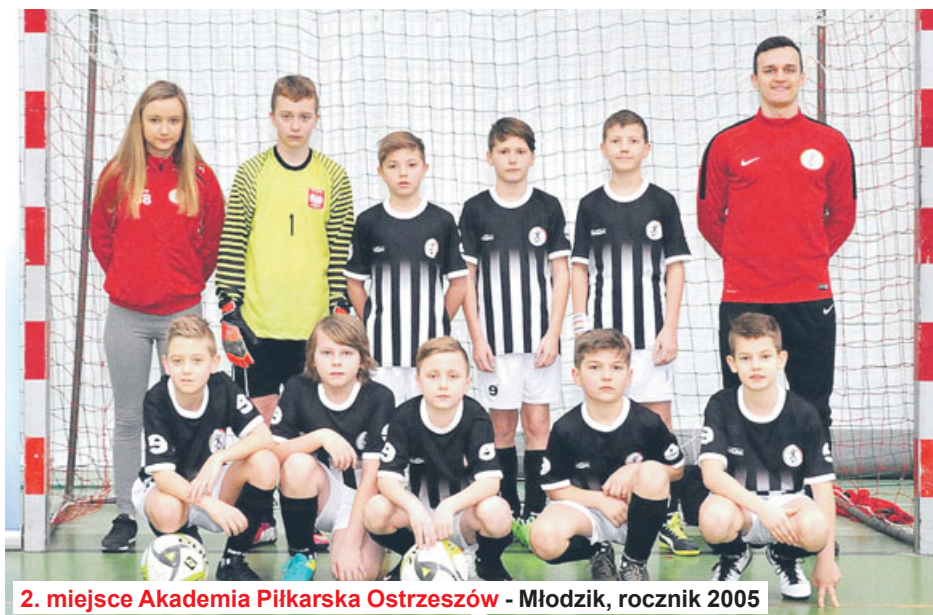
2. miejsce Akademia Piłkarska Ostrzeszów - Młodzik, rocznik 2005