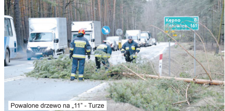
Powalone drzewo na „11” - Turze

- 24 lutego na ul. Nowej w Ostreszowie zajął się materiał palny znajdujący się tuż przy piecu. Strażacy