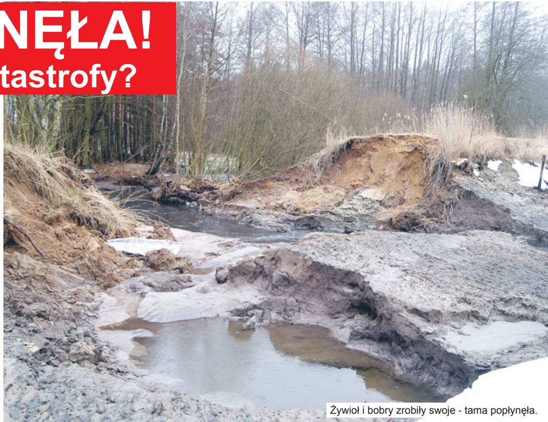
Żywioł i bobry zrobiły swoje - tama popłynęła.