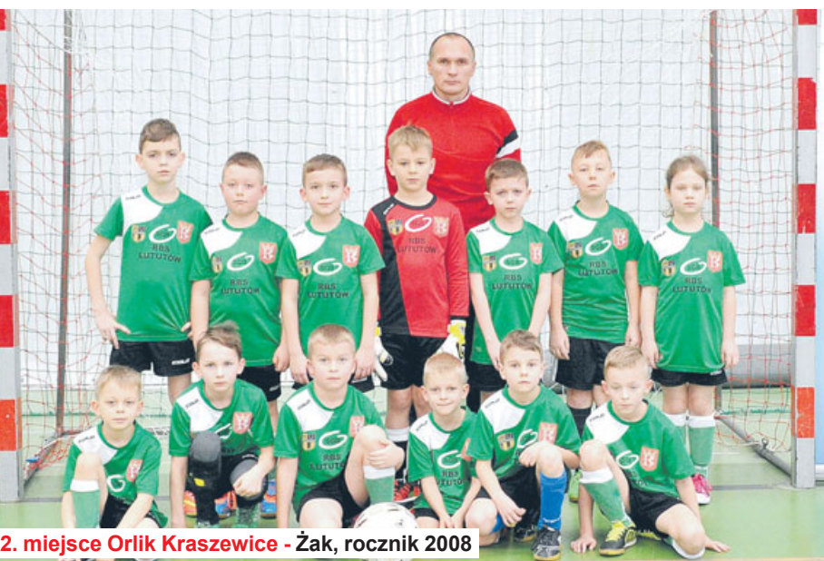
2. miejsce Orlik Kraszewice - Żak, rocznik 2008