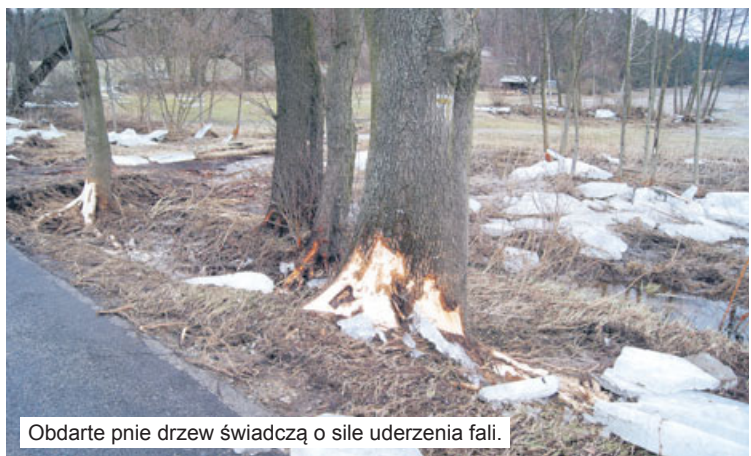
Obdarte pnie drzew świadczą o sile uderzenia fali.

spodarowana” przez bobry grobla zrobiła się jak dziurawe sito, napór wody, spotęgowany wielogodzinna ulewą, dokończył dzieła zniszczenia. Rozmiękła, podziurawiona tama popłynęła! Uwolniona woda nabrała rozpędu, niesiona nurtem strugi przepływającej przez środek stawu. Wodny żywioł rozszedł tafle kry, której potężne kawałki staranowały drugą groblę, oddzielającą środkowy staw od trzeciego. Aż trudno uwierzyć, że w ciągu kilku, może kilkunastu minut