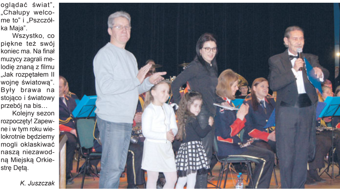
oglądać świat”, „Chałupy witamy” i „Pszczółka Maja”. Wszystko, co piękne też swój koniec ma. Na finał muzyka zagrała melodię znaną z filmu „Jak rozpadł się II wojnę światową”. Były brawa na stojąco i światowy przebieg na bis... Kolejny sezon rozpoczął Zapewne i w tym roku wielokrotnie będziemy mogli oklaskiwać naszą niezawodną Miejską Orkiestrę Dętą. K. Juszcak