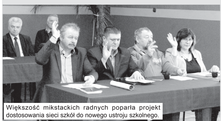
Większość mikstackich radnych poparła projekt dostosowania sieci szkół do nowego ustroju szkolnego.