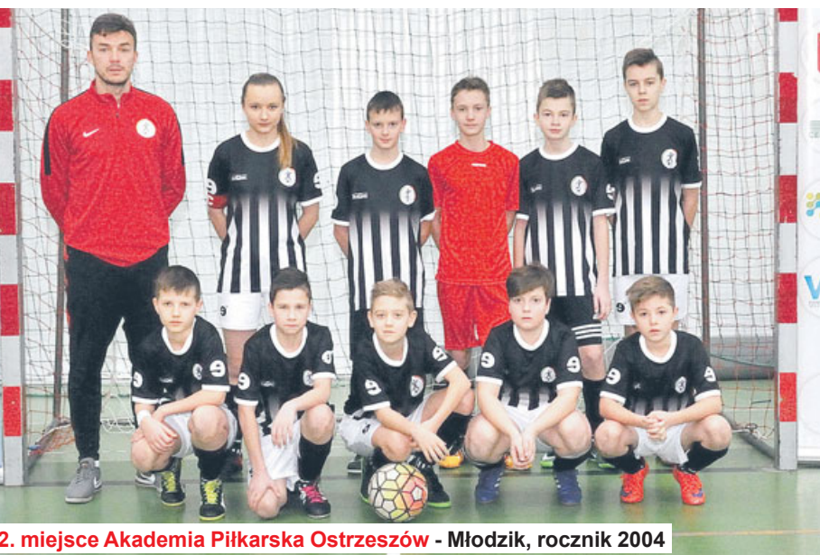
2. miejsce Akademia Piłkarska Ostrzeszów - Młodzik, rocznik 2004