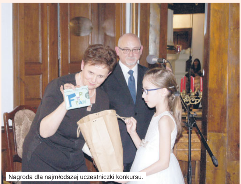
Nagroda dla najmłodszej uczestniczki konkursu.