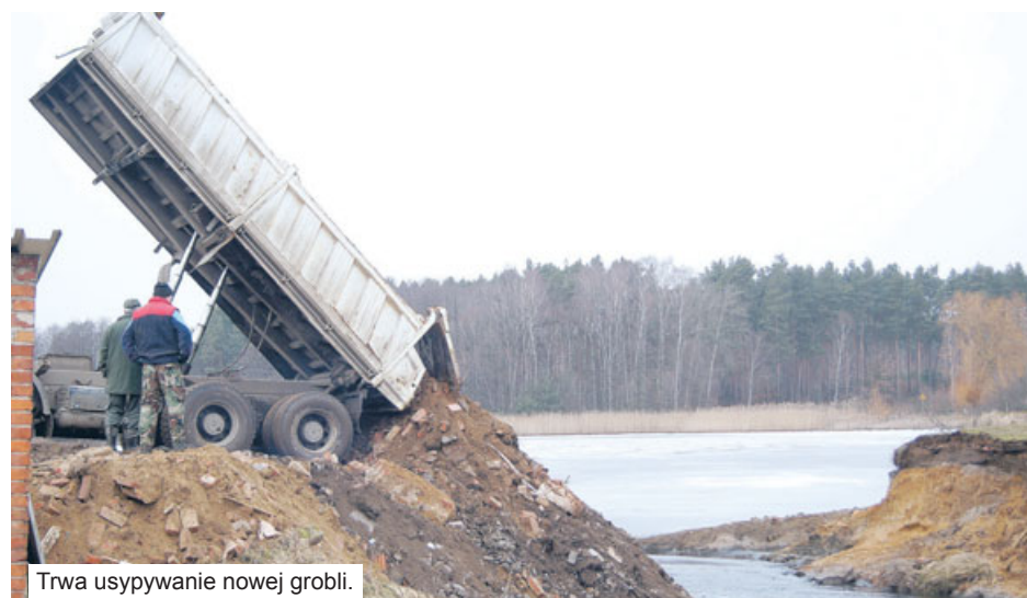
Trwa usypywanie nowej grobli.

Tak prawdopodobnie całe to groźne zdarzenie wyglądało. Wprawdzie nie ma bezpośrednich świadków katastrofy, ale niektórzy mieszkańcy pobliskich domów mówią o tym, że słyszeli jakiś hałas, huk