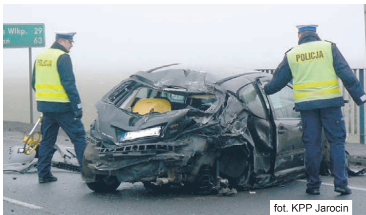
fol. KPP Jarocin