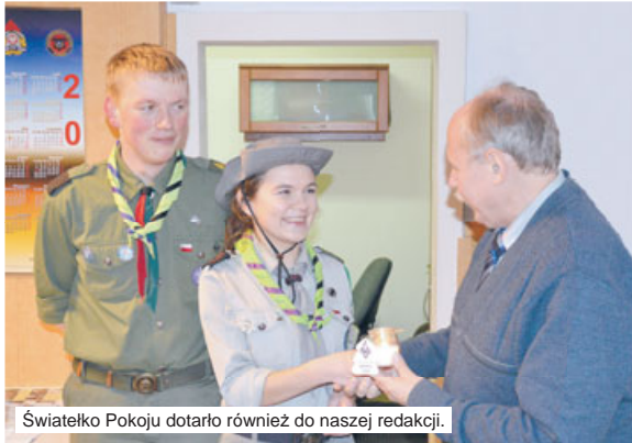
Świąteczne Pokoju dotarło również do naszej redakcji.

„Odważnie tworzymy pokój” - to hasło tegorocznej edycji Betlejemskiego Świątecznego Pokoju, które od niedzieli gości w domach ostrzeszowskich harcerzy ZHP. 11 grudnia harcerze z Hufca ZHP Ziemi Ostrzeszowskiej udali się do Częstochowy, by podczas mszy św. odpalić ogień przekazany tego samego dnia polskim harcerzom przez słowackich skautów. Polska to jeden z wielu krajów biorących udział w betlejemskiej sztafecie, której celem jest szerzenie idei braterstwa i pokoju. Wszystko rozpoczęło się 9 grudnia w Grocie Narodzenia Pańskiego, kiedy to odpalono Świąteczne. Ten symboliczny płomień i motto, jakie ze sobą niesie, przypomina o tym, co w czasie świąt Bożego Narodzenia jest ważne, a o czym, niestety, często zapominamy. Już w poniedziałek Betlejemskie Świąteczne Pokoju trafiło m.in. do Urzędu Miasta i Gminy oraz Starostwa w Ostrzeszowie. Na przestrzeni tygodnia ogień dotrze do wielu innych instytucji, szkół, kościołów i przyjaciół harcerstwa. BŚP będzie można znaleźć też przy stoisku ZHP w Ostrzeszowie na jarmarku bożonarodzeniowym.