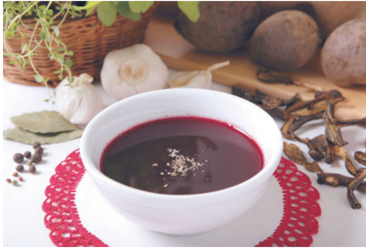
Barszcz czerwony, którego można posmakować u członka Sieci Dziedzictwa Kulinarne Wielkopolska w restauracji Pod Niebieniem w Poznaniu.

W tym rękopisie zawarty jest przepis, jaki możemy dokładnie odtworzyć i również dzisiaj wykorzystać. Do smażonego kar-