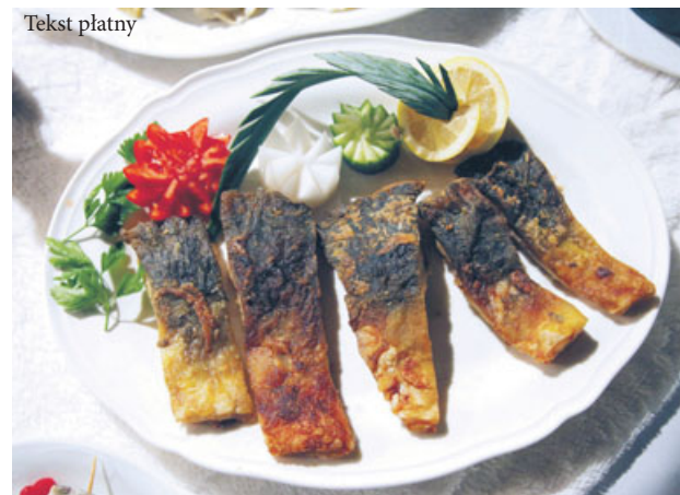
Karp smażony, którego serwuje m.in. członek Sieci restauracja Gościniec Gryszczyńówka - Wargowo k. Obornik (arch. Głosu Wielkopolskiego).