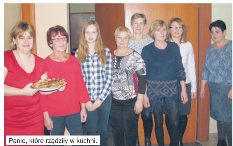
Panie, które rządziły w kuchni.