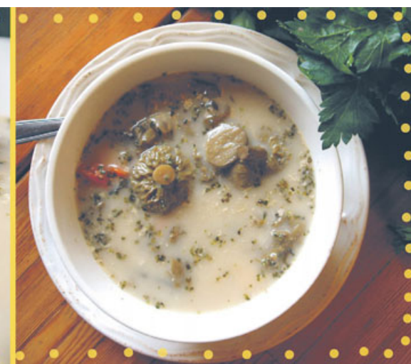
Tradycyjna zupa grzybowa, której można spróbować u członka Sieci Dziedzictwa - restauracja Jaśkowa Zagroda.

W literaturze znajdujemy niezliczone przepisy na potrawy z karpia: po polsku, na niebiesko, po żydowsku, podawany smażony w dzwonkach czy gotowany na parze. Jednak jednym z najstarszych przepisów jest karp po polsku w sosie szarym, niegdyś bardzo popularny w Wielkopolsce. Danie to, z pewnymi modyfikacjami, przetrwało w nielicznych domach do dzisiaj. Zachęcamy, by wrócić do tej bardzo smacznej, a jednocześnie wykwintnej potrawy. Potrawa ta została wpisana pod nazwą „karp smażony z sosem szarym” na Listę Produktów Tradycyjnych Ministra Rolnictwa i Rozwoju Wsi jako wielkopolskie danie tradycyjne. Podstawą staropolskiego sosu szarego była dawniej świeża krew z karpia.