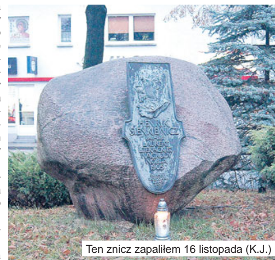
Ten znicz zapaliłem 16 listopada (K.J.)