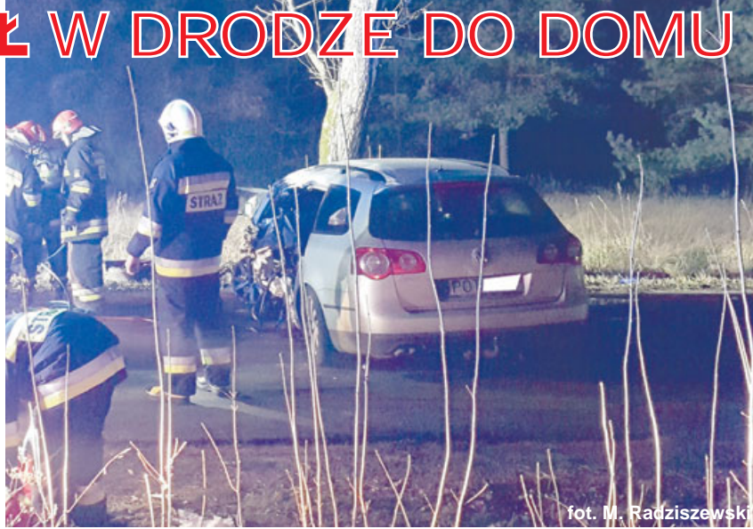
fol. M. Radziszewski