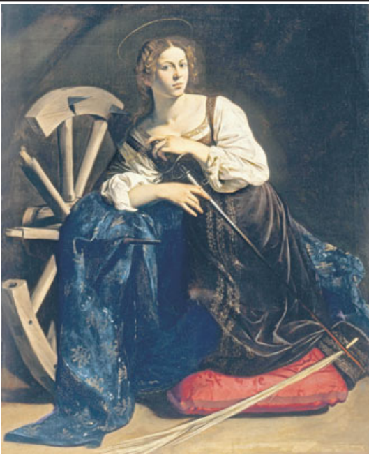
Święta Katarzyna z Aleksandrii - obraz pędzla Caravaggia

andrzejki - wróżb panieli). Wtedy kawaler ścinał gałązkę wiśni i stawiał do wody. Gdy gałązka zakwitła na Boże Narodzenie, oznaczało to, że ślub odbędzie się jeszcze w najbliższym karnawale. Natomiast, aby poznać imię przyszłej żony, należało również w wigilię św. Katarzyny wieczorem położyć pod poduszkę karteczki z imionami znanych dziewcząt i następnego dnia wylosować spod poduszki jedną z tych karteczek. Na niej znajdowało się imię wybranki.