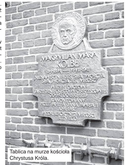
Tablica na murze kościoła Chrystusa Króla.

Zdjęcie o. M. Kolbe z zakonnikami pochodzi ze zbiorów Muzeum Regionalnego w Ostrzeszowie. Z jego udostępnienie dziękujemy portalowi „Dzieje Ostrzeszowa”.