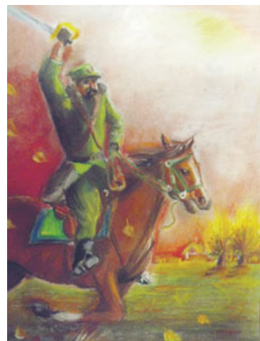
Radika Łepska - nagroda.