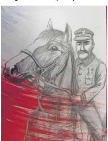
Hanna Brząkała - kwalifikacja do wystawy.