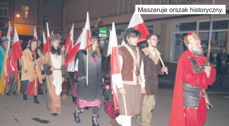
Maszerując orszak historyczny.