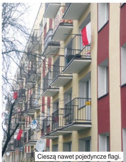
Cieszą nawet pojedyncze flagi.

święta, naszego święta? A przecież wtedy, gdy nakazowo trzeba było fla-