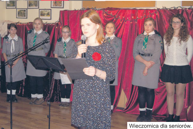
Wieczorka dla seniorów.