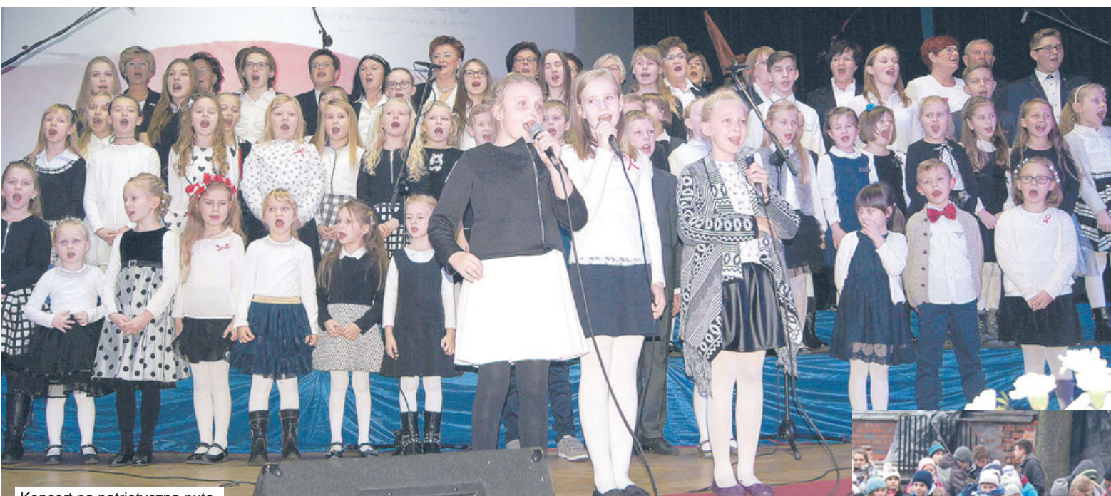
Koncert na patriotyczną nutę.

Do niepodległości wiele wiodło dróg. 123 lata nie było Polski na mapach Europy, ale nawet wtedy, w najczarniejszych latach zaborów i kolejnych powstańch kłęk żyła w sercach ludzi mieszkających nad Wisłą, w wierszach Norwida, w powieściach Sienkiewicza i w pacierzu odmawianym po polsku. Aż wreszcie nadszedł ten szczególny dla Polaków 1918 rok. Historia i Opatrzność dały nam mężów stanu, jak Piłsudski, Paderewski i Dmowski, którzy