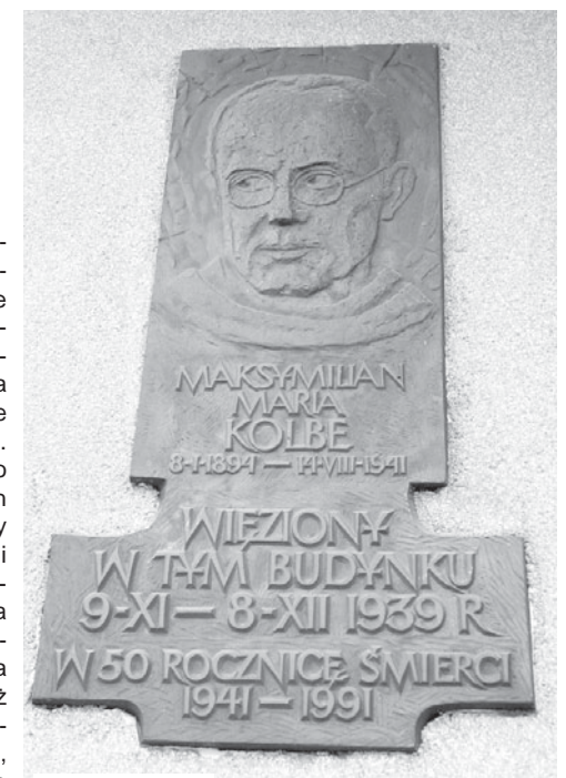
Tablica przy LO.