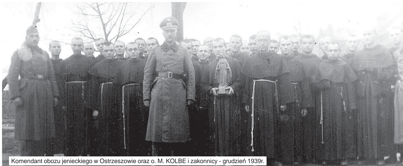
Komendant obozu jenieckiego w Ostrzeszowie oraz o. M. KOLBE i zakonnicy - grudzień 1939r.

Wśród mieszkańców Ostrzeszowa żywa jest pamięć pobytu o. Maksymiliana w naszym mieście. Jego imieniem nazwano