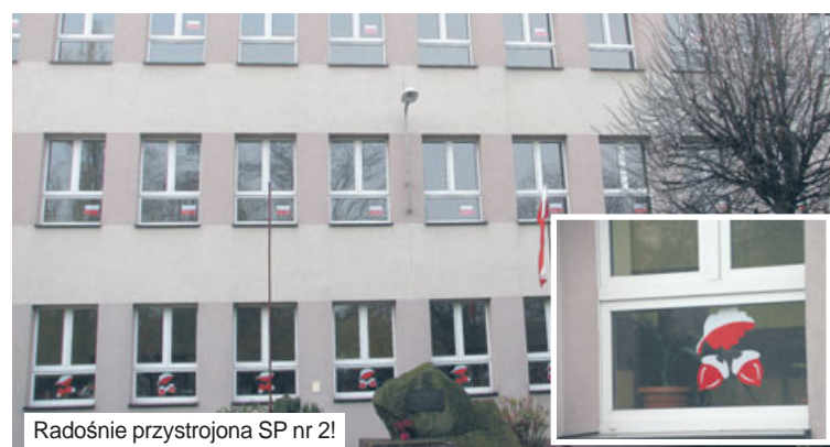
Radośnie przystrojona SP nr 2!