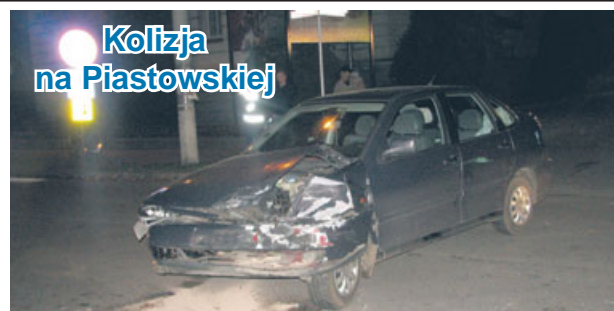
Kolizja na Piaśtowskiej

Funkcjonariusze zatrzymali 30-latkę prawo jazdy, skierują także wniosek o ukaranie jej do Sądu Rejonowego w Ostrzeszowie.