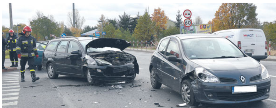
Teraz nie pojeździ

6 listopada, tuż przed południem w Kochłowach doszło do wypadku. Kierująca volkswagenem polo, 22-letnia mieszkanka gminy Ostrzeszów, nie dostosowała prędkości jazdy do panujących warunków, w wyniku czego zjechała na przeciwny pas jezdni i doprowadziła do czołowego zderzenia z samochodem marki Toyota Yaris. Pokrzywdzony to 35-letni mieszkaniec powiatu kępińskiego. Uczestnicy zdarzenia byli trzeźwi. 22-lątka doznała obrażeń, hospitalizowano ją w ostrzeszowskim szpitalu. Policjanci prowadzą dalsze postępowanie w tej sprawie.