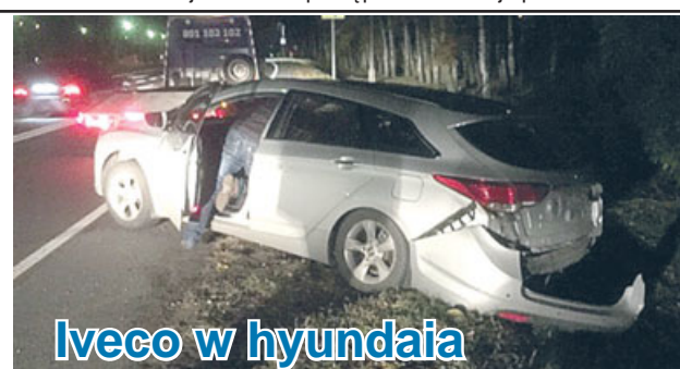
Iveco w hyundaia

Tej samej nocy (00.36) dyżurny Policji otrzymał zgłoszenie o wypadku drogowym, do którego doszło w Ostrzeszowie - Pustkowie. 18-letnia mieszkanka gminy Ostrzeszów, kierująca audi a3, nie dostosowała prędkości do panujących warunków, zjechała na prawe pobocze i uderzyła w drzewo. Dziewczyna była trzeźwa. W samochodzie znajdowało się również dwóch pasażerów, jeden z nich - 22-letni mieszkaniec Ostrzeszowa - odniósł poważne obrażenia - przewieziono go do ostrzeszowskiego szpitala. 18-lątka straciła prawo jazdy. Prowadzone jest dalsze postępowanie w tej sprawie.