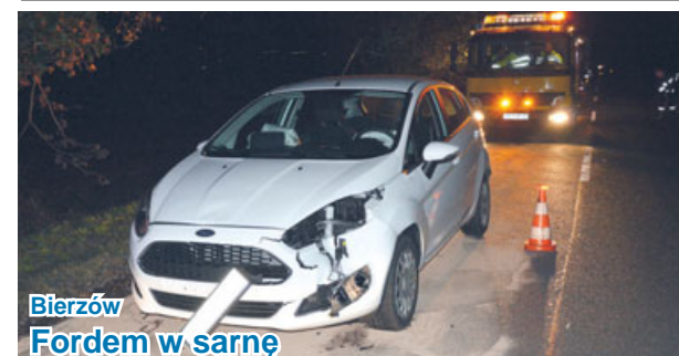
Bierzów Fordem w sarnę

Kierująca oplem corsą 20-lątka (mieszkanca Mirkowa) nie dostosowała prędkości do panujących na drodze warunków, co skończyło się dachowaniem i „ładowaniem” w przydrożnym rowie. Na szczęście ani kobiecie, ani jej pasażerowi nic się nie stało. Do zdarzenia doszło 2 listopada, po godzinie 7.30 w Torzeńcu. Za naruszenie przepisów 20-lątka została ukarana mandatem.