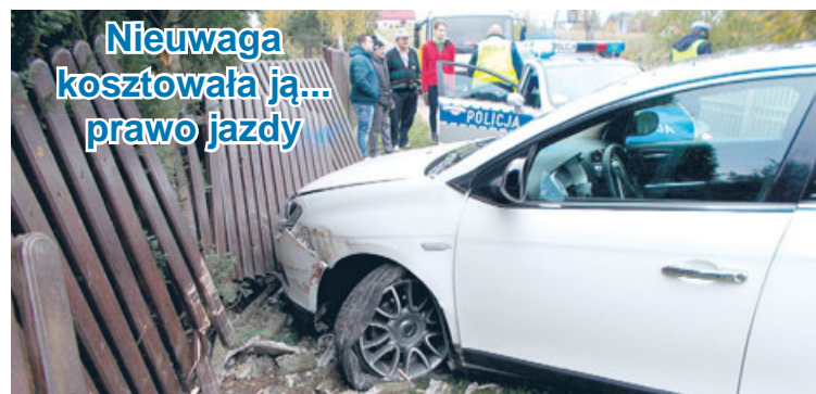
Nieuwaga kosztowała ją... prawo jazdy

Po godzinie 23.00, w piątek (4.11.) w Ostrzeszowie na ul. T. Kościuszki doszło do kolizji. 21-letni mieszkaniec miejscowości Pamiątków, kierujący iveco daily, nie ustąpił pierwszeństwa i doprowadził do zderzenia z samochodem marki Hyundai, którym kierowała 64-letnia mieszkanka Szczecina. Sprawca przyjął mandat karny.