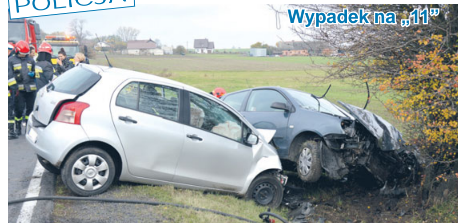
Wypadek na „11”

6 listopada, tuż przed południem w Kochłowach doszło do wypadku. Kierująca volkswagenem polo, 22-letnia mieszkanka gminy Ostrzeszów, nie dostosowała prędkości jazdy do panujących warunków, w wyniku czego zjechała na przeciwny pas jezdni i doprowadziła do czołowego zderzenia z samochodem marki Toyota Yaris. Pokrzywdzony to 35-letni mieszkaniec powiatu kępińskiego. Uczestnicy zdarzenia byli trzeźwi. 22-lątka doznała obrażeń, hospitalizowano ją w ostrzeszowskim szpitalu. Policjanci prowadzą dalsze postępowanie w tej sprawie.