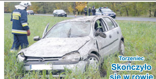
Torzeniec Skończył się w rowie

4 listopada, po godzinie 17.30 patrol Policji powiadomił dyżurnego, że „najechał” na kolizję drogową, do której doszło w Ostrzeszowie, na ul. Piaśtowskiej. Sprawcą okazała się 25-letnia mieszkanka gminy Grabów, kierująca seatem cordoba. Kobieta nie ustąpiła pierwszeństwa i doprowadziła do zderzenia z jadącym z przeciwka citroenem berlingo, którym kierował 46-letni mieszkaniec gminy Ostrzeszów. Uczestnicy kolizji byli trzeźwi. Za spowodowanie kolizji kobieta została ukarana grzywną oraz punktami karnymi.