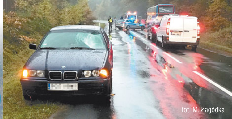
fol. M. Łagódka