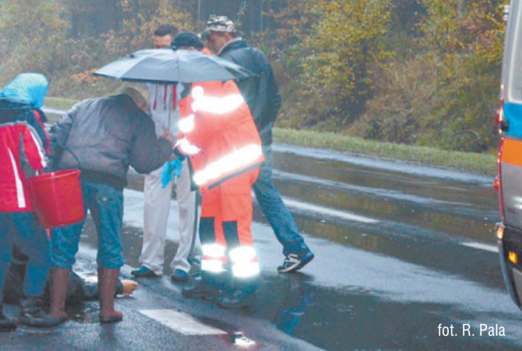
fol. R. Pała