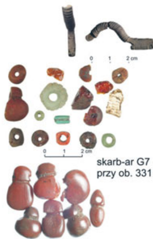
skarb-ar G7 przy ob. 331

Drzwi Panele podłogowe Dywany Płytki ceramiczne Umywalki i kran Kabiny i brodziki Wanny i ubikacje