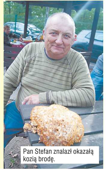
Pan Stefan znalazł okazałą koźią brodę.