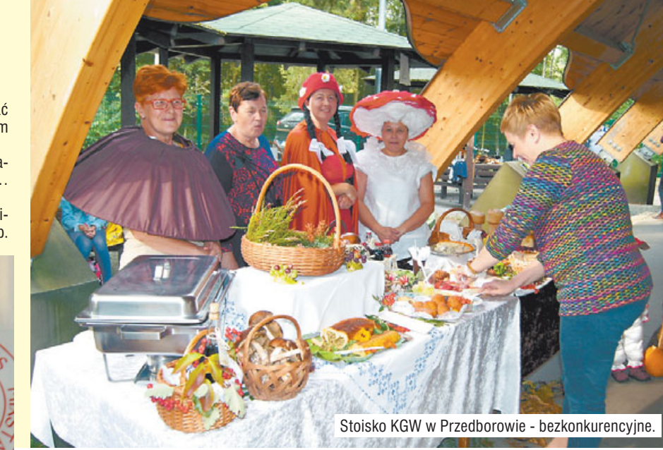
Stoisko KGW w Przedborowie - bezkonkurencyjne.