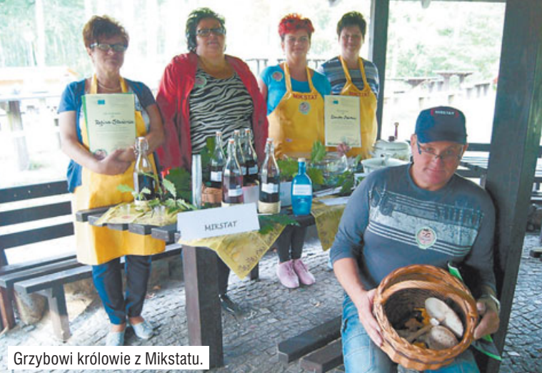
Grzybowi królowie z Mikstatu.

Przez cały czas trwała loteria fantowa, kupujący mogli wylosować ciekawe nagrody - m.in. telewizor, meble czy rower oraz wiele różnych drobiazów. Na koniec dnia odbyła się zabawa taneczna.