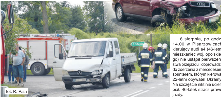
fol. R. Pala

6 sierpnia, po godz. 14.00 w Piszarzowicach kierujący audi a4 (46-letni mieszkaniec woj. opolskiego) nie ustąpił pierwszeństwa przejazdu i doprowadził do zderzenia z mercedesem sprinterem, którym kierował 22-letni obywatel Ukrainy. Na szczęście nikt nie ucierpiał. 46-latek stracił prawo jazdy.