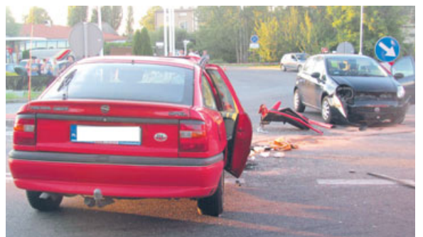
fol. PSP Kępno

Sześć osób zostało rannych w wypadku, do którego doszło w minioną niedzielę na drodze nr 8, w pobliżu McDonald's'a w Kępnie. Wśród uczestników zdarzenia była 19-letnia mieszkanka gminy Ostrzeszów.