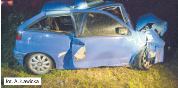
fol. A. Ławicka