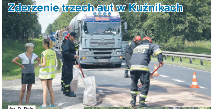
fol. R. Pala

Do zderzenia trzech samochodów doszło 4 sierpnia, po godz. 13.00 w Kuźnikach.