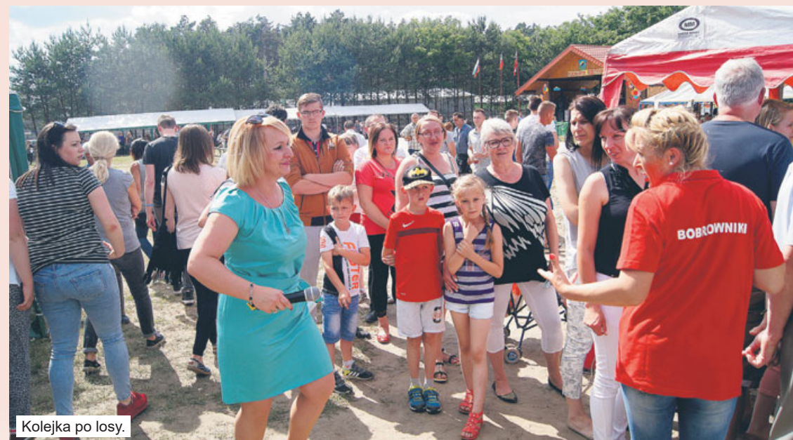
Kolejka po losy.