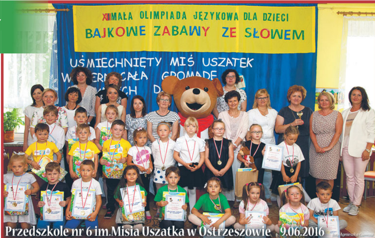
Przedszkole nr 6 im. Misia Uszatka w Ostrzeszowie 9.06.2016