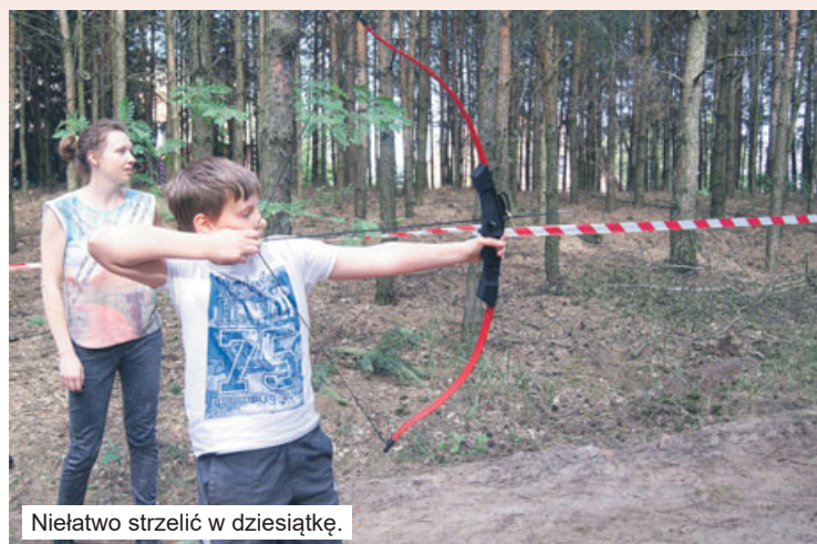
Niełatwo strzelić w dziesiątkę.