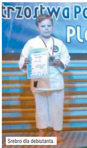
Srebro dla debiutanta.