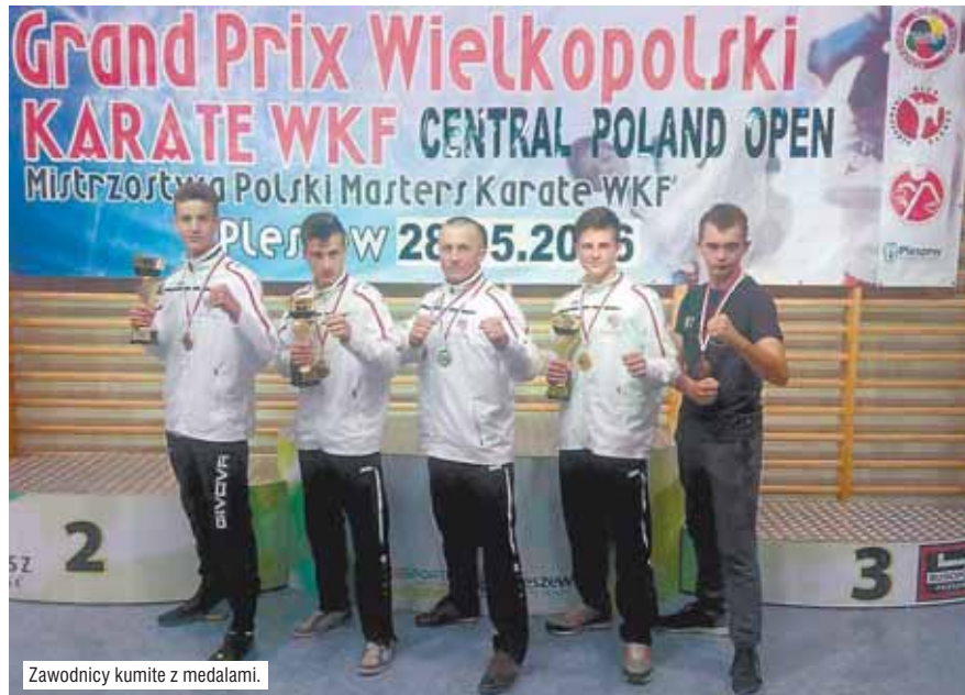
Zawodnicy kumite z medalami.