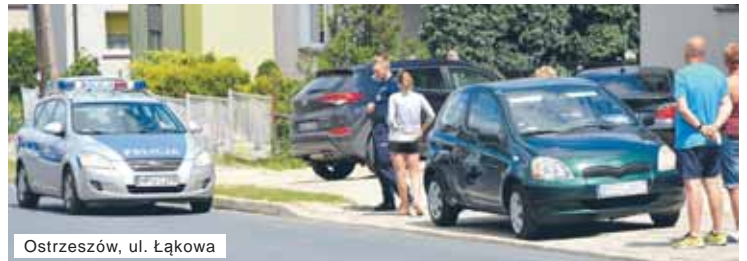
Ostrzeszów, ul. Łąkowa

Godzinę później doszło do stłuczki na ul. Łąkowej w Ostrzeszowie. Kierująca hyundaiem, skręcając na prywatną posesję, nie upewniła się, że jest już wyprzedzana przez samochód marki Toyota. Na szczęście, skończyło się tylko na obtarciach samochodów.