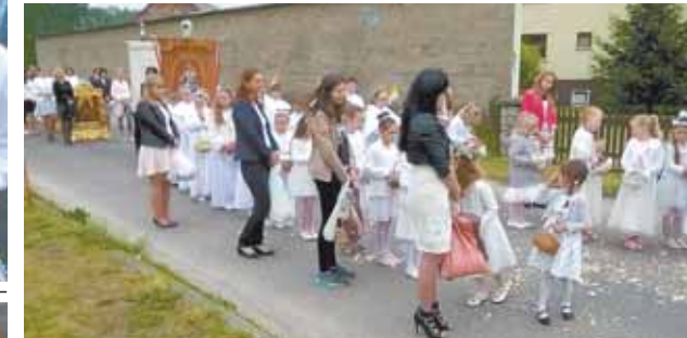
Pięknie, miło i pobożnie przebiegła tegoroczna uroczystość Bożego Ciała w Parzynowie. Brawo parafianie, brawo szanowni księża, ukłony dla dzieci i ich rodziców!