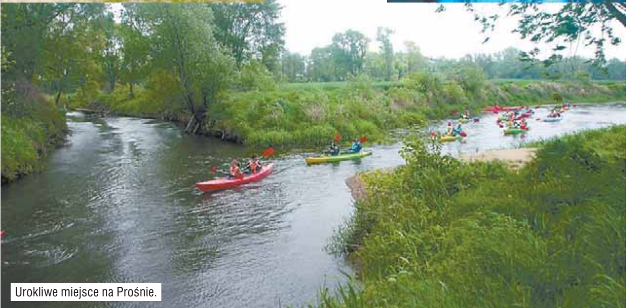
Urokliwe miejsce na Prośnie.