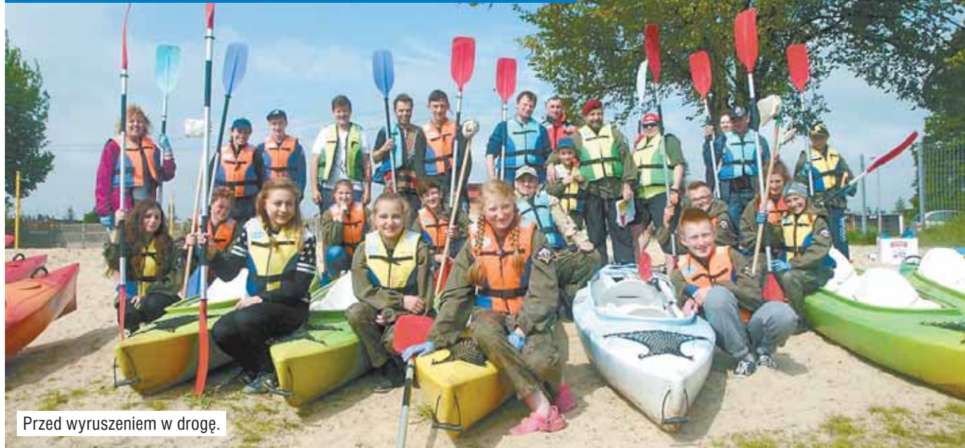
Przed wyruszeniem w drogę.

14 maja, po raz pierwszy w tym roku, z przystani w Grabowie n. Prosną wypłynęli młodzi i starsi, aby oczyścić rzekę. Mimo że robią to systematycznie po kilka razy w roku, to w wodzie ciągle pojawiają się „tony” nowych śmieci.