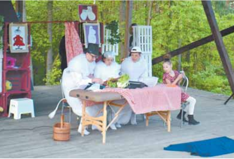
Liczne atrakcje czekały na uczestników imprezy, która odbyła się w miniony piątek (13 maja) pod Krzyżem Milenijnym, a potem w Ośrodku Rehabilitacji i Rekreacji „Na Wzgórzu” w Parzynie. Od kilku lat, właśnie w maju, obchodzony jest Dzień Godności Osoby Niepełnosprawnej Umysłowo. Dobra to okazja,