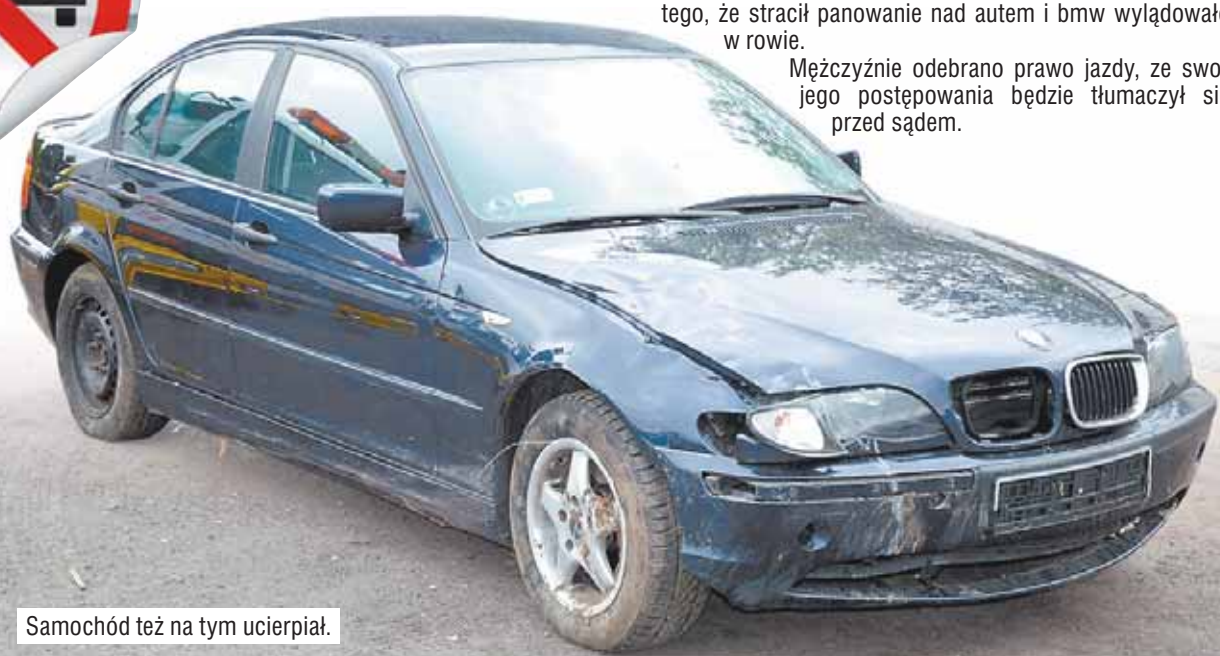
Samochód też na tym ucierpiał.

Mężczyźnie odebrano prawo jazdy, ze swojego postępowania będzie tłumaczył się przed sądem.