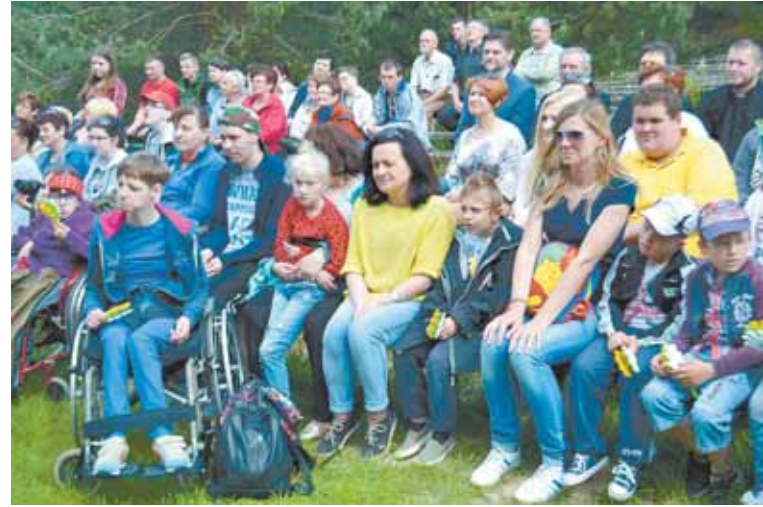
nego Ośrodka Szkolno-Wychowawczego w Ostrzeszowie oraz działającego przy SOSW przedszkola, a także kilka zaprzyjaźnionych placówek z powiatu kępińskiego.