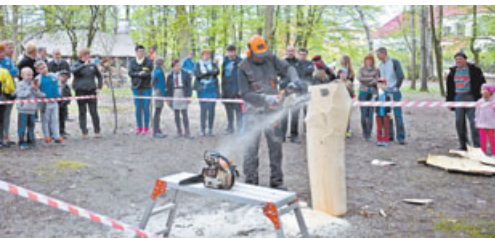
PK Fot. Jacek Sikora

W godzinach popołudniowych w mikstaccym parku odbyła się świąteczna majówka z zabawą taneczną, zorganizowaną przez Miejsko-Gminny Ośrodek Kultury w Mikstacie.