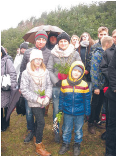
W Niedzielę Palmową przy Krzyżu Wielkopolskim już od wielu lat spotyka się młodzież z całej diecezji kaliskiej. Tegoroczne spotkanie