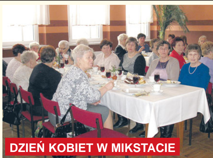
DZIEŃ KOBIET W MIKSTACIE

Do zawsze uroczystości w Mikstacie należą te organizowane przez mikstackie Koło Emerytów, Rencistów i Inwalidów. Także w tym roku zarząd koła wykazał się inicjatywą i z iście młodzieńczą energią przygotował jakże sympatyczną uroczystość z okazji Dnia Kobiet, która odbyła się w ośrodku kultury.