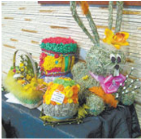
Ponad dwieście wielkanocnych stroków, pałem i pisanek można podzi-