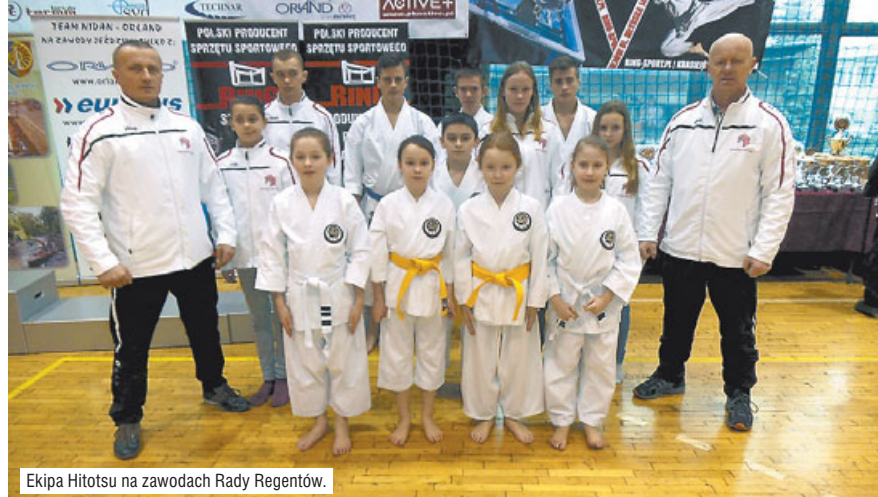
Ekipa Hitotsu na zawodach Rady Regentów.

W sobotę, 12 marca, rozegrano XXII Turniej Karate „Rada Regentów” . Do miejscowości Zawadzkie wyjechała liczna, bo aż 12-osobowa ekipa zawodników klubu „Hitotsu” Ostrzeszów. Znaleźli się w niej doświadczeni zawodnicy ale także ośmioro debiutantów.