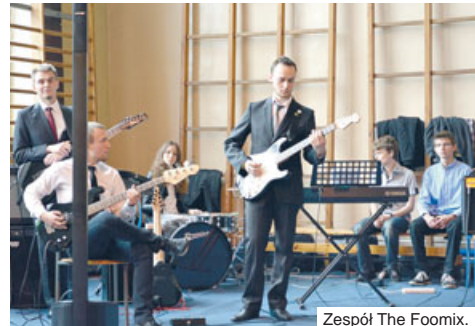
Zespół The Foomix.

i na stronie projektu: www.foomix.fulara.com .