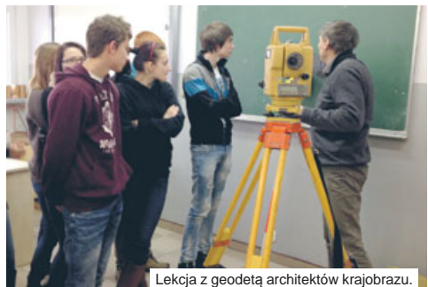
Lekcja z geodetą architektów krajobrazu.

w kraju w rankingu „Perspektyw” w zdawalności egzaminów zawodowych. Uczniowie tego kierunku kształcenia zdobywają wysokie noty w Konkursach BHP i na Olimpiadzie Młodych Producentów Rolnych. Architekci zajęli VIII miejsce w tym samym rankingu. Swoje umiejętności sprawdzają uczestnicząc w różnych konkursach.