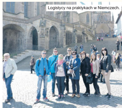
Logistycy na praktykach w Niemczech.

Ważnym elementem nowoczesnego edukowania są realizowane projekty i praktyki. Najciekawszym doświadczeniem dla uczniów stają się praktyki odbywane za granicą. W ramach programu Erasmus + uczniowie odbywają praktyki w Wielkiej Brytanii (informatyki i uczniowie technikum gastronomicznego), w Niemczech