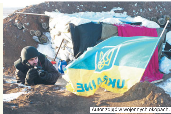
Autor zdjęć w wojennych okopach.

Wstrząsających widoków, które wciąż mam przed oczami, było wiele. Wioska zbombardowana, opuszczone domy z pozostawionym dobytkiem, i ludzkie ciała. Czołg stojący na drodze, w który to - jak powiedział nam żołnierz - trafił pocisk,