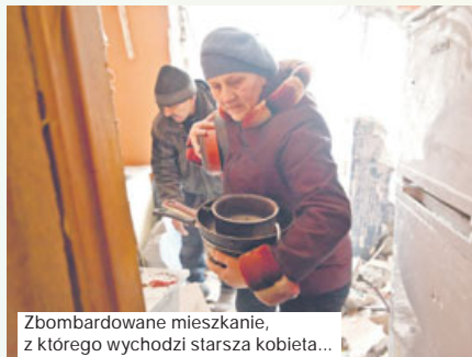
Zbombardowane mieszkanie, z którego wychodzi starsza kobieta...

Wysłuchał: Włodzimierz Juszczak