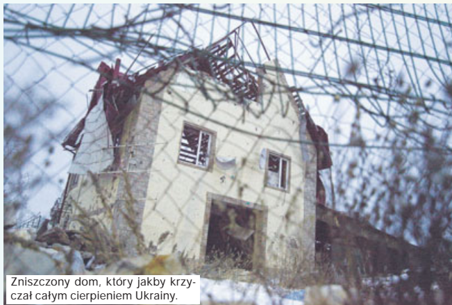
Zniszczony dom, który jakby krył całe cierpienie Ukrainy.