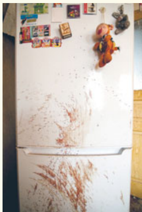
Lodówka pomazana krwią młodego żołnierza, zastrzelonego przez snajpera.