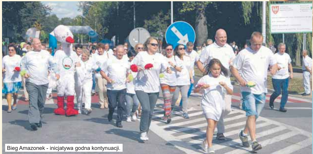
Bieg Amazonek - inicjatywa godna kontynuacji.

nastąpił z ulicy Zamkowej, za to trasa (bez zmian) prowadziła Zamkową, deptakiem przy „11”, Sikorskiego, przez Rynek, Powstańców Wielkopolskich, by zakończyć się na Armii Krajowej, w pobliżu „Lilijki”.