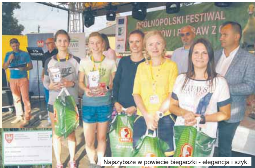
Najszybsze w powiecie biegaczki - elegancja i szyk.

- Chcíamosy pokazać, że jednak działamy, zbieramy fundusze. Przy okazji zachęcające do badań cytologicznych i mamograficznych - mówi główna