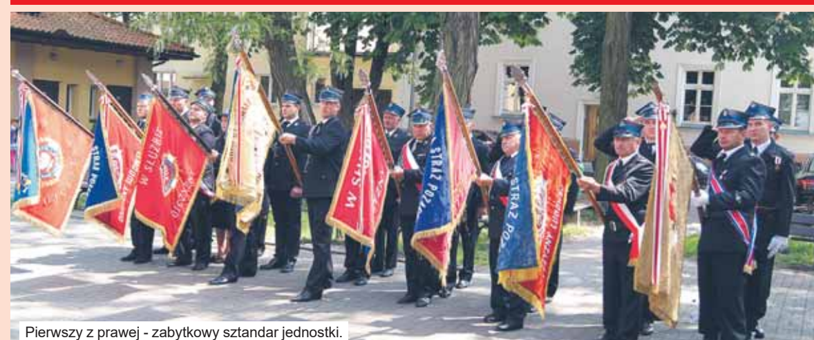
Pierwszy z prawej - zabytkowy sztandar jednostki.