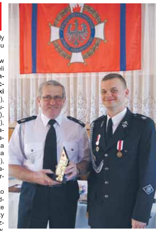
Gratulowali także inni uczestnicy w zebraniu goście.