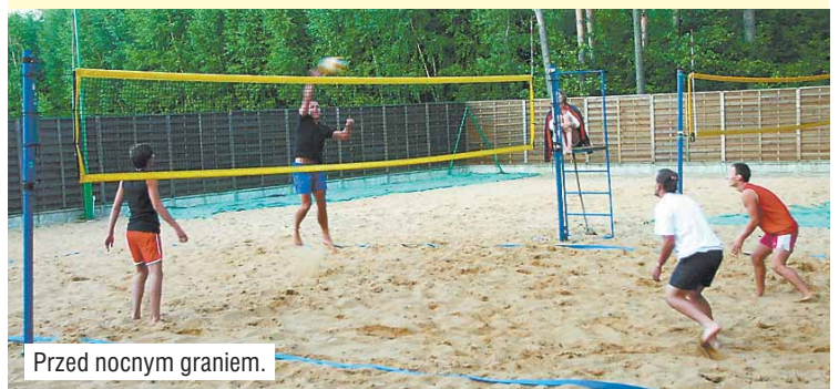
Przed nocnym graniem.