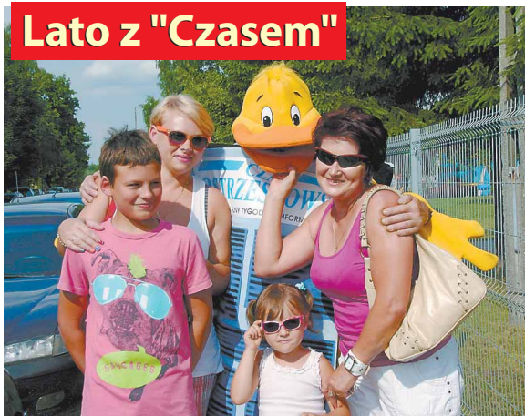
Przednia zabawa na pikniku w Skrzynkach (relacja na str. 16.- 17.)