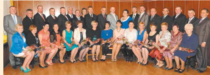
JUBILACI 25 LECIA ZAWARCIA ZWIĄZKU MAŁŻEŃSKIEGO ROK 2012

10 listopada Urząd Stanu Cywilnego w Doruchowie zorganizował jubileusze par mażeńskich, obchodzących 25, 30, 35, 40, 45 i 50-lecie pożycia małżeńskiego. To już tradycja, która zakorzeniła się na terenie gminy Doruchów od kilkadziesiąt lat. Na zaproszenie Urzędu odpowiedziało 56 par Jubilatów, w tym 6 par Jubilatów, obchodzących złote gody - pary te otrzymały od prezydenta RP medale „Za Długoletnie Pożycie Małżeńskie”, oraz jedna para, obchodząca 60-lecie pożycia małżeńskiego. Uroczystości rozpoczęły się o godz. 15.00 mszą św. w kościele parafialnym w