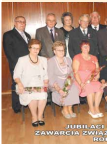
JUBILACI 60 I 50 LECIA ZAWARCIA ZWIĄZKU MAŁŻEŃSKIEGO ROK 2012