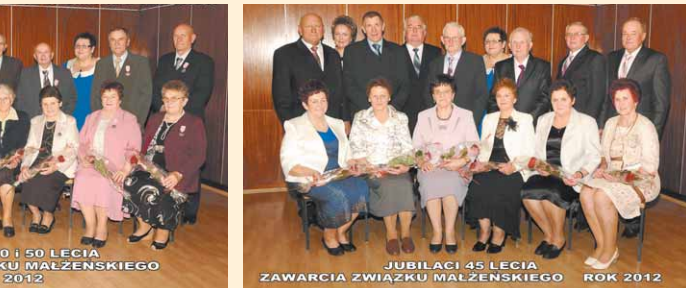
JUBILACI 45 LECIA ZAWARCIA ZWIĄZKU MAŁŻEŃSKIEGO ROK 2012