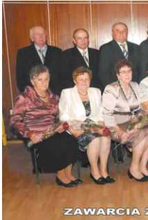
JUBILACI 40 LECIA ZAWARCIA ZWIĄZKU MAŁŻEŃSKIEGO ROK 2012