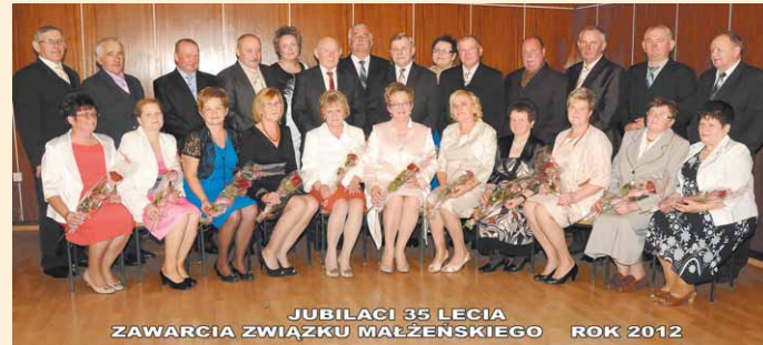
JUBILACI 35 LECIA ZAWARCIA ZWIĄZKU MAŁŻEŃSKIEGO ROK 2012