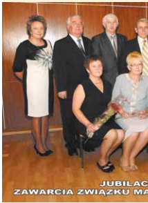
JUBILACI 30 LECIA ZAWARCIA ZWIĄZKU MAŁŻEŃSKIEGO ROK 2012