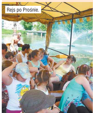
Rejs po Prośnie.

Popatrzmy, jak dzieciaki z Grabowa i okolic spędzały lipiec.