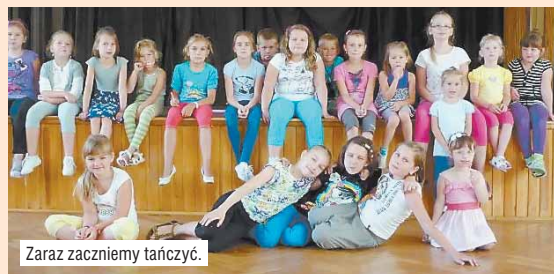
Zaraz zaczniemy tańczyć.