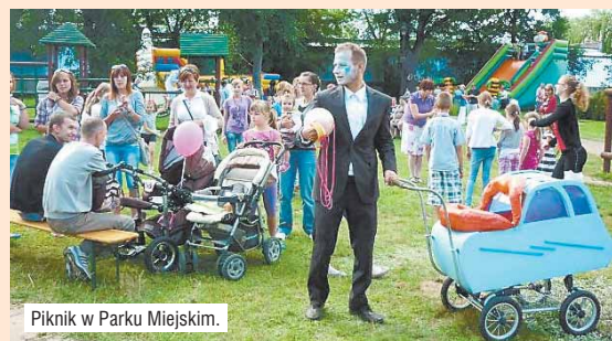
Piknik w Parku Miejskim.