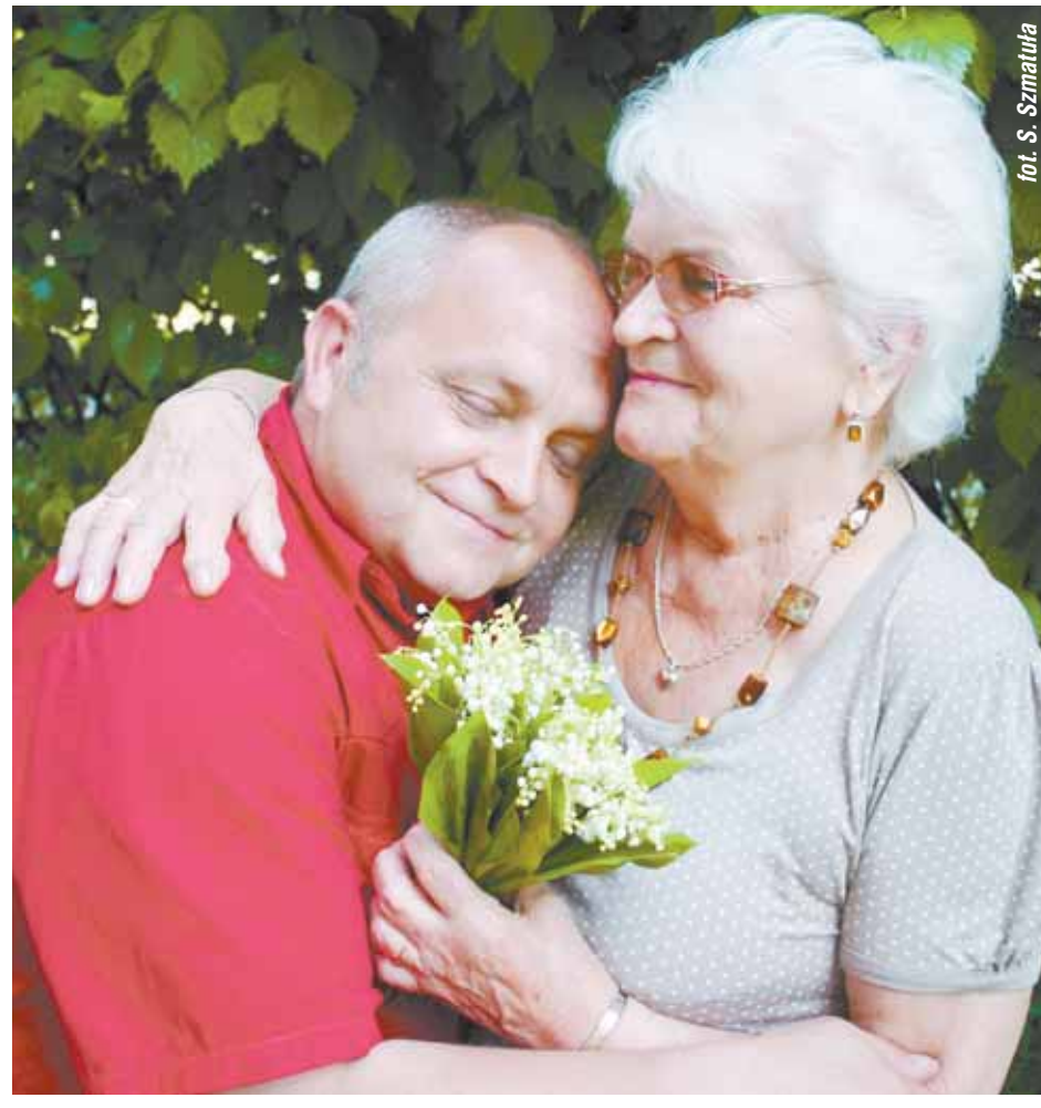
fol. S. Szmatuła