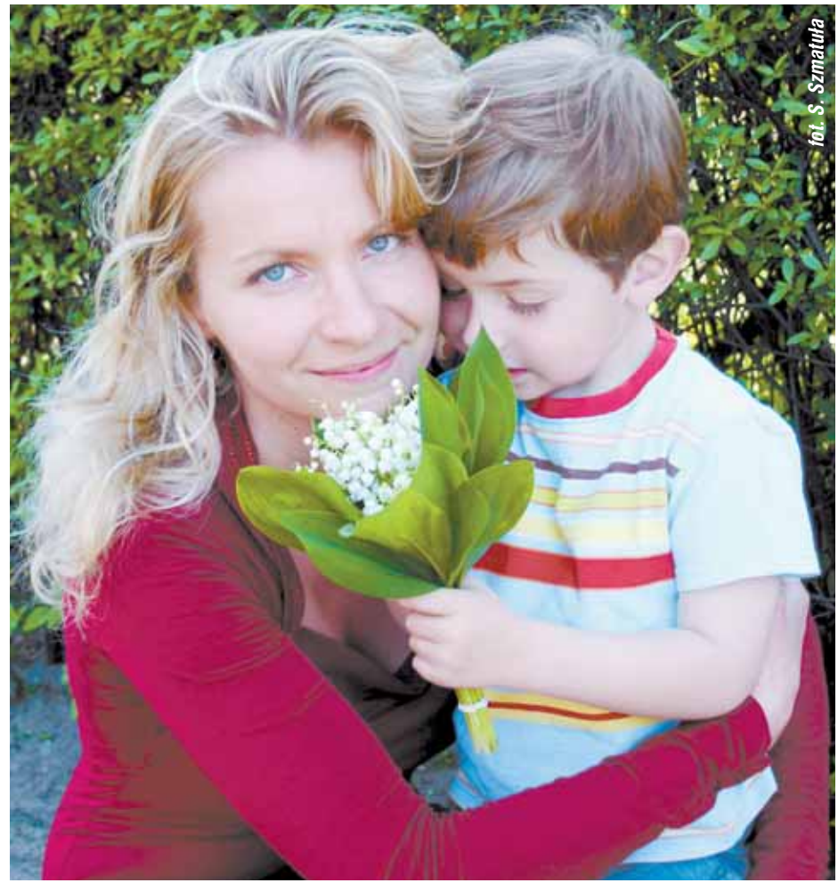
fol. S. Szmatuła