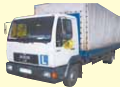
PRAWO JAZDY KAT. A,B,C,D,E,T