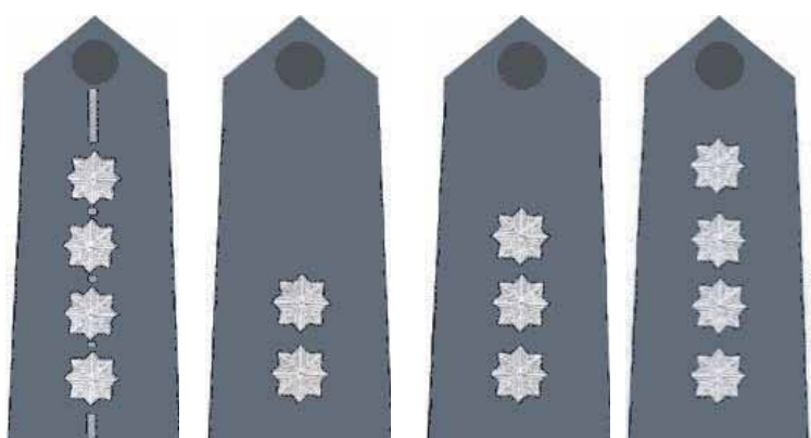
aspirant sztabowy / podkomisarz / komisarz / nadkomisarz