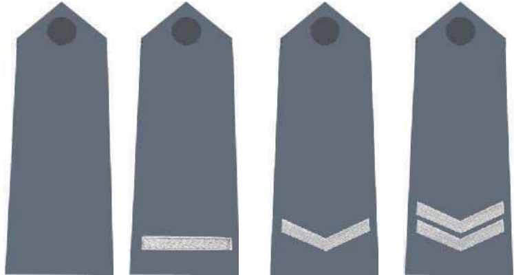
posterunkowy / starszy posterunkowy / sierżant / starszy sierżant

Dla tych, którzy chcieliby uniknąć pomylenia posterunku z aspirantem lub starszego sierżanta z młodszym chorążym przygotowaliśmy swoistą ściągę. Co tydzień przedstawiać będziemy kolejną porcję stopni obowiązujących w ramach danej służby. Rozpoczynamy od tych, z którymi miewiamy najczęstiej, czyli policjantów. Bohaterami następnych odcinków cyklu będą żołnierze, marynarze, lotnicy, strażacy i strażnicy miejscy. Ł. Śmiatacz