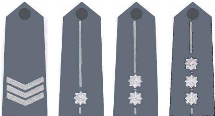
sierżant sztabowy / młodszy aspirant / aspirant / starszy aspirant